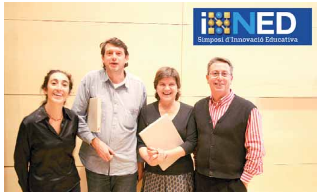
Imatge 1. Institut Celestí Bellera

servir de marc conceptual. Se'n pot destacar el plantejament de la necessitat que hi ha a la societat del coneixement de configurar una intel·ligència col·lectiva que ens permeti dur a terme operacions més intel·ligents de les que podríem desenvolupar cadascú de nosaltres per compte propi.