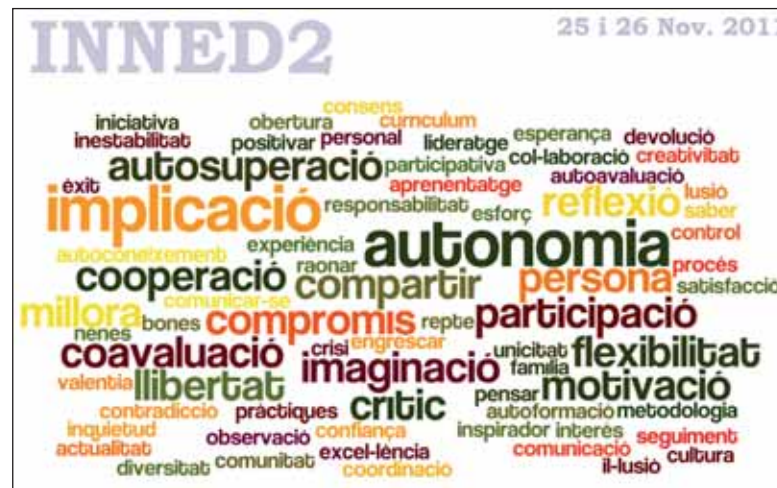
Imatge 2. Núvol amb les idees claus sorgides en el Simposi INNED2