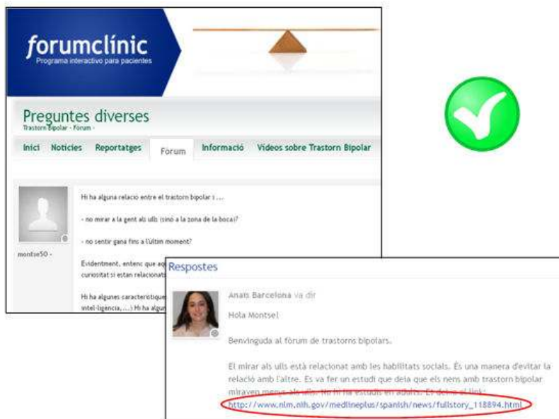
Figura 6. forumclínic. Fòrum sobre trastorn bipolar ( http://www.forumclinic.cat/trastorn_bipolar/forum/preguntes-diverses )

Un exemple de bona praxis el trobem al forumclínic ( http://www.forumclinic.cat/sobre_forumclinic ) : els dubtes plantejats als fòrums no només obtenen una resposta del moderador sinó que sovint aporten informació complementària que avala allò que es diu o bé que serveix per aprendre'n més, tal com es veu a la Figura 6.