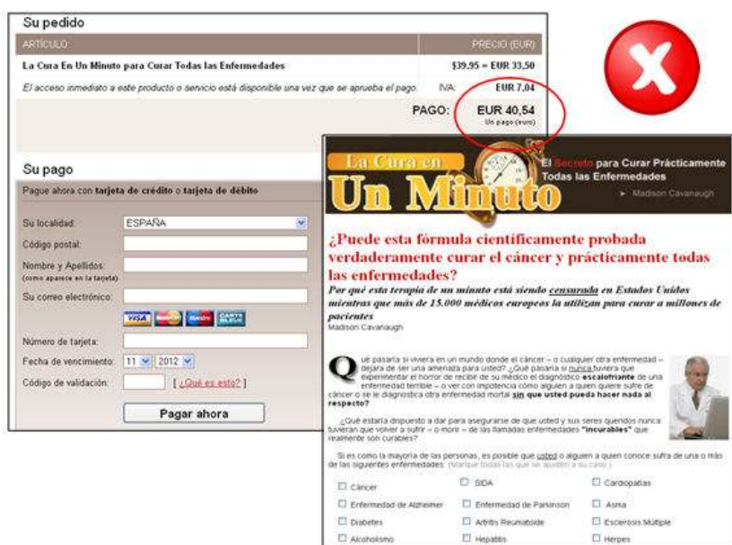
Figura 4. La cura en un minuto ( http://www.curaenunminuto.com/ ). Només amb la compra del llibre es podrà tenir accés a la fórmula per curar el càncer

En aquest grup, també s'hi inclouen pàgines que no expliciten clarament la seva voluntat comercial però que, arribats a un cert punt, és necessària una transacció econòmica, per la compra d'un producte (un llibre o un DVD explicatiu), per un servei (una consulta personalitzada o un tractament), per una contribució a un projecte, etc.