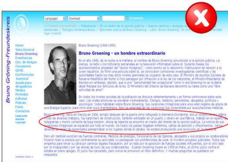
Figura 2. Bruno Groening. La curación por el camino espiritual. ( http://www.bruno-groening.org/espanol/brunogroening/defaultbrunogroening.htm ) El creador d'aquest mètode va tenir molts oficis (fuster, repartidor, estibador, etc.) i cap formació específica relacionada amb la salut tot i que garanteix a la seva pàgina curacions de tota mena.

En d'altres casos, no hi ha cap ommissió en relació amb la formació de l'autor o de la persona responsable però cal ser crítics i saber valorar si aquell perfil mereix confiança.