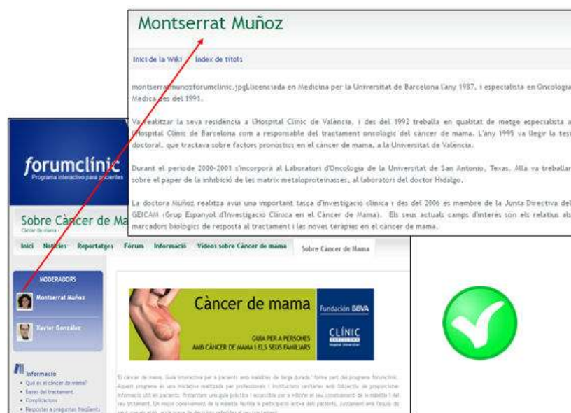
Figura 1. Forumclínic. Càncer de mama ( http://www.forumclinic.cat/cancer_mama/sobre ). Els moderadors de l'àrea són fàcilment identificables. A més, se'n pot consultar la formació i l'experiència professional.

Per exemple, al web forumclínic ( http://www.forumclinic.cat/sobre_forumclinic ), un programa adreçat als pacients i directament vinculat a l'Hospital Clínic de Barcelona, s'hi explica no només què és i qui en forma part, sinó que, en cada àmbit, s'hi identifica fàcilment el responsable dels continguts.