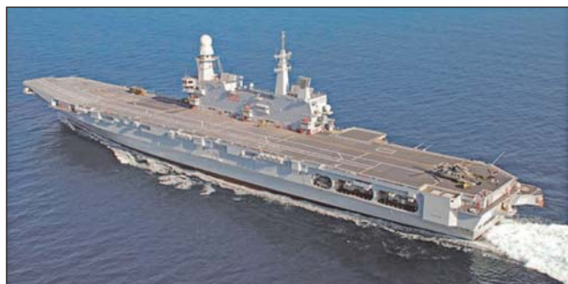
7. ábra. Az olasz CAVOUR repülőgép-hordozó

rolási kapacitás, az élelmezési és a javító munkaállomás biztosítása.