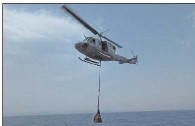
3. ábra. Augusta-Bell könnyűhelikopter külső teheremeléssel szállít ellátmányt az EU NAVFOR MED misszióban

bercsempészek és emberkereskedők szabad mozgásának korlátozására, visszatartására, őrizetbe vételére, hogy megszakítsák ezt a büntetendő üzleti tevékenységet.