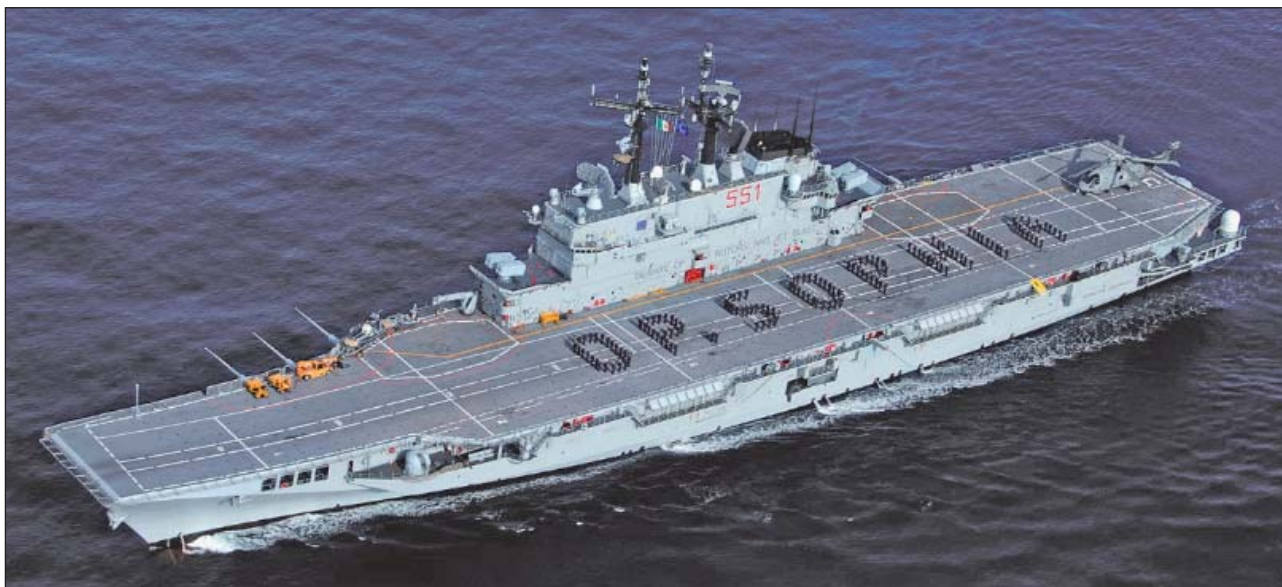
1. ábra. Az EU NAVFOR MED misszió zászlóshajója az ITS GARIBALDI helikopter-hordozó