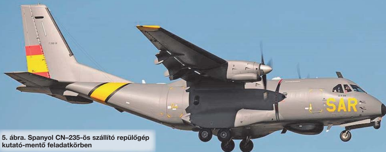
5. ábra. Spanyol CN-235-ös szállító repülőgép kutató-mentő feladatkörben