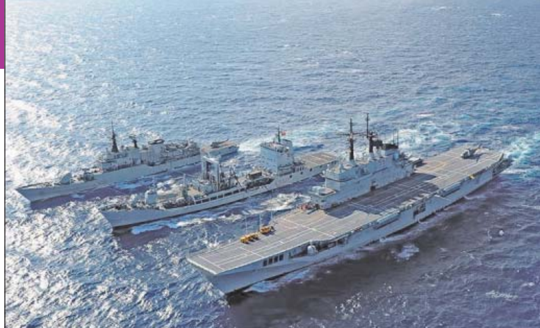
4. ábra. Az ITS GARIBALDI helikopter-hordozó tengeri utántöltése egy olajszállító hajóról

Az EUNAVFOR MED Operation Sophia mellett a térségben tevékenykedik az olasz parti őrség, a FRONTEX műveletei (a Poseidon és a Triton), a NATO Operation Sea Guardian és számos nem kormányzati szervezet (Non-Governmental Organization, NGO), mint például a Save the children (Védd a gyermekeket) vagy a Médecins sans Frontières (Orvosok határok nélkül) szervezete.