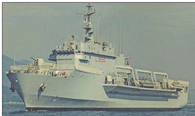
6. ábra. Az olasz SAN GIORGO partra szállító hajó (LPD – Landing Platform Dock)