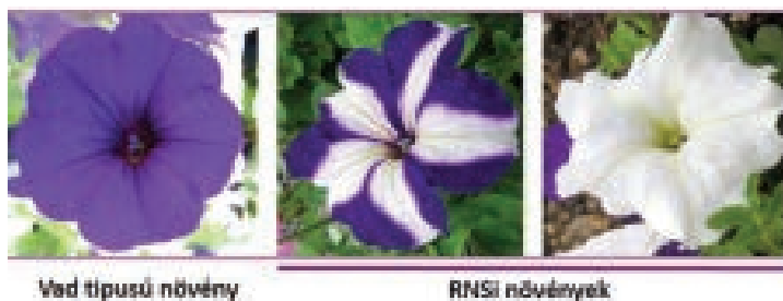
2. ábra Lila festékanyag termeléséért felelős gént juttattak be mesterségesen petúniákba. A mesterségesen bevitt génről íródott hírvívó RNS beindította a bevitt gén, a növény saját (endogén) génjének csendesítését (együttes csendesítését, azaz ko-szuppresszióját). A fehér szektorokban beindul az RNS csendesítés, míg a sötét szektorokban nem (illusztráció)

és Baulcombe egy évvel később kimutatta, hogy jellegzetes 21–25 nukleotidhosszúságú, kisméretű RNS-ek felhalmozódása kíséri a folyamatot. A RNS-csendesítés mechanizmusának fonálférgekben való feltárásáért Fire és Mello 2006-ban orvosi Nobel-díjat kapott. Bár a növényeken dolgozó kutatók úttörő munkát végeztek ezen a területen, kimaradtak ebből az elismerésből.