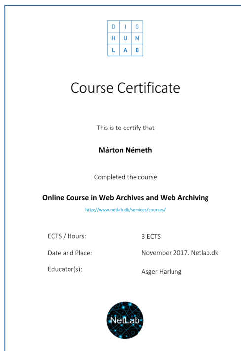
2. ábra A kurzus elvégzésével szerzett bizonyítvány

Tanulásgként mindenképpen megállapítható, hogy a webarchiválás esetében szerencsés ez a fajta oktatásszervezés, ahol az elméleti háttérként szolgáló ismereteket írásos formában bocsátják rendelkezésre, maga a szeminárium pedig erre az anyagra (is) támaszkodva, konkrét gyakorlati célkitűzések mentén zajlik. Különös figyelmet fordítottak arra, hogy miként lehet a napi munkában, az adott kutatási témakörben hatékonyan hasznosítani a tapasztalatokat. A legtöbbet egymástól tanultunk. A tervezés lépései, a szoftveres problémák, az aratási hibák számbavétele, a konkrét nehézségekkel történő megbirkózás állt a munka középpontjában, így a kurzus igen jól segítette az itthoni webarchiválási kísérleti projekt szakmai megalapozását.