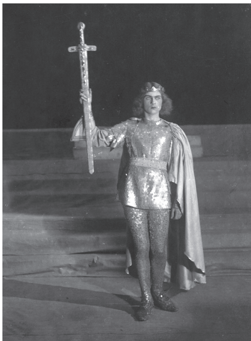
3. kép. A Szent Imre misztérium jelenete , Dienes Gedeon MOHA-azonosító: dvh-f-00698.

közösség rendezvényén a Szent Imre ünnepe alkalmából, a műből részleteket adtak elő, Szent Imre apoteózis címmel. Az 1930. november 8-i est műsora a következő volt: az estet Hász István püspök ünnepi beszéde nyitotta, majd szavalat, dalok és más énekszámok következtek. A szünetet követően Kriegs-Au Emil plébános, pápai kamarás mondott beszédet, melyet Dienes és Bárdos első misztériumjátéka a Hajnalvárás , valamint az eredeti Szent Imre misztériumjáték egy részlete, a Szent Imre apoteózis következett.