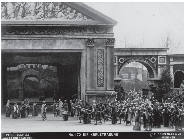
2. kép. Az oberammergaui passiójáték 1910-ben