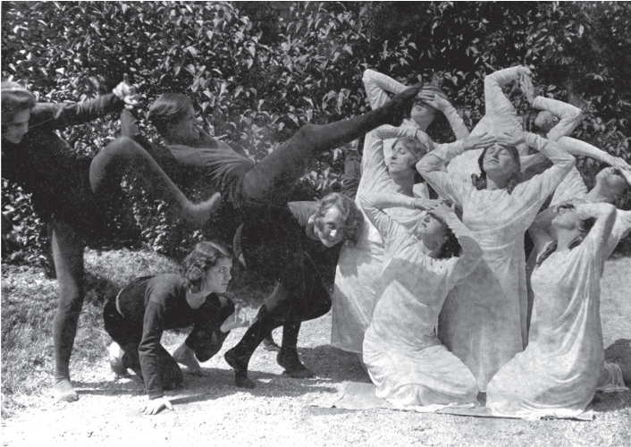
1. kép. A jók és rosszak küzdelme, a Rózsák szentje misztérium kerti próbajelenete jelmezben, az Orkesztika Iskola kertjében

MOHA-azonosító: dvh-f-a3-091.