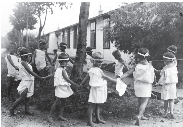
2. kép. A Montessori Kinderheim lakói „Oltikáznak” (Oltika az orkesztika gyerekeve) a kertben. Bécs-Grinzing 1922.

(fotográfus ismeretlen) EDAR – dvh-f-a3-009 – MOHA