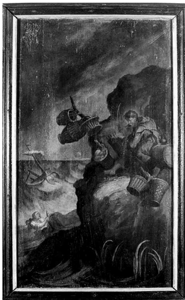
1. Huetter Lukács: Szent Martinianus, 1749–1760 között. Fa, olaj. Az egi irlalmas rendház ablaktáblájának részlete

Az ablaktáblán Evagrius egyszerű kunyhójában, íróasztalánál ül egy fonott karosszékben, és egy nagy, nyitott könyvet tanulmányoz. A kunyhóban könyvek és irattekercesek veszik körül. Az egi festmény a Solitudo sive vitae patrum eremicolarum (1585–1586) című metszetsorozat 19. lapja után készült (4. kép). 9 A rézmetszeten az is látható, hogy Evagrius egy szerzetesekből álló közösséghez tartozott, ahol mindenki egy-egy külön kunyhóban élt. Az egi ablaktáblán – valószínűleg a függőleges