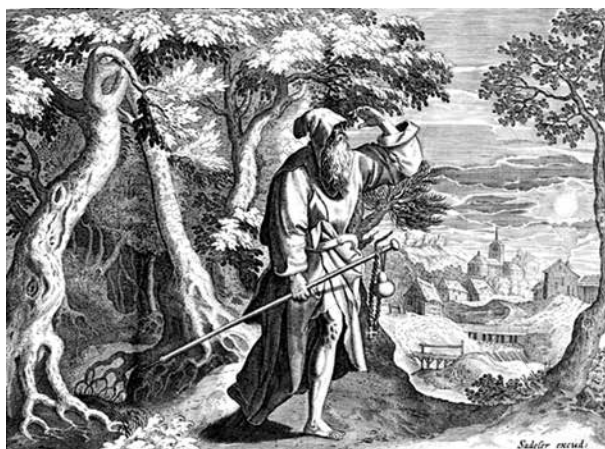
12. Johannes és Raphael Sadeler: Mutius remete, 1585–1586. Rézmetszet, papír

A harmadik ablaktáblán ábrázolt Szent Vilmos és Szent Onufrius remete életében csak az a közös vonás, hogy mindketten szerzetesként éltek egy ideig, majd a remeteséget, az aszkéta életmódot választották. Assisi Szent Ferenc és Egyiptomi Szent