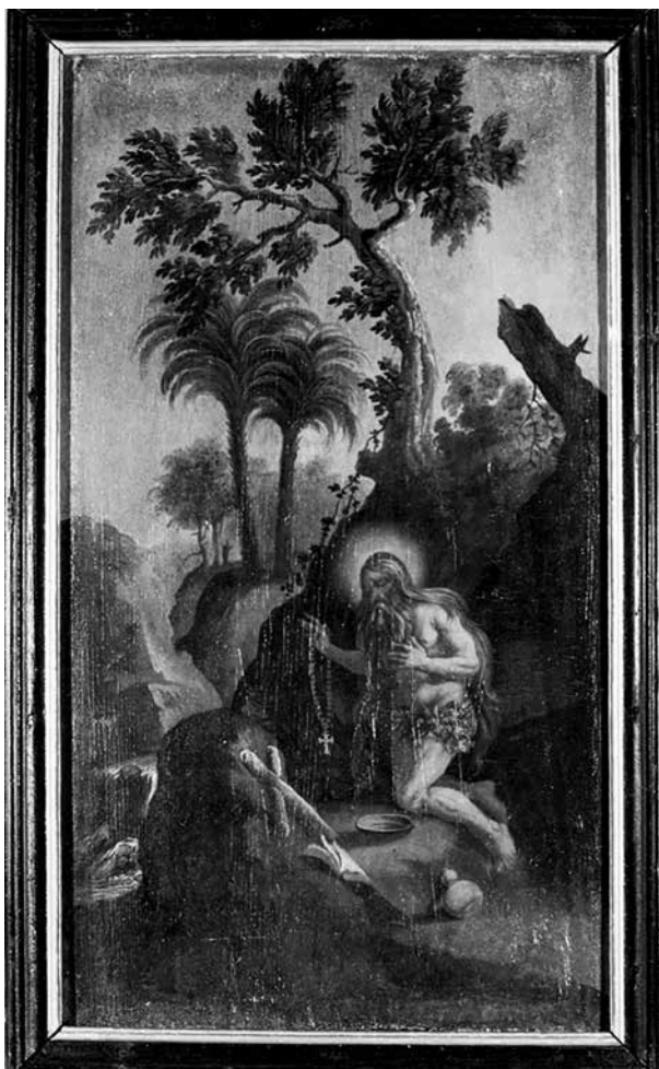
7. Huetter Lukács: Szent Onufrius, 1749–1760 között. Fa, olaj. Az egri irgalmas rendház ablaktáblájának részlete

A hatodik ablaktábla szent életű remetéket ábrázol. Felül Mutius, akit a már említett Solitudo sive vitae patrum eremicolarum című metszetsorozat 9. lapja után festett meg a művész (11–12. kép). 20 A tájhátrteret a metszethez képest módosította: hoz-