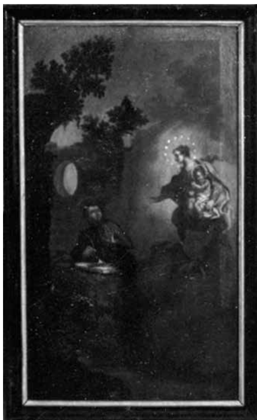
10. Huetter Lukács: Madridi Szent Izidor és Loyolai Szent Ignác, 1749–1760 között. Fa, olaj. Az egri irgalmas rendház egyik ablaktáblája