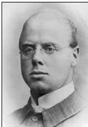
1. kép: A huszonéves br. Podmaniczky Pál