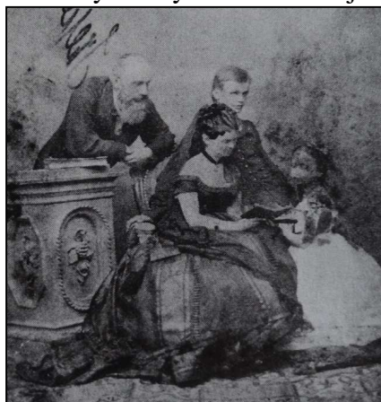
Forrás: Ondrejčková 2003: 214.