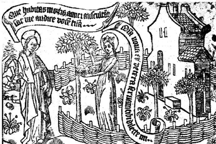
1. illusztráció „(Cod. 6/A)”

P. S. J.: A fenti példák kiegészítéseképpen idézni kívánok itt egy sajátosan érdekes esetet. Mint tudjuk, az ‚Énekek éneke’ a közvetlen (az első fokú) értelmező interpretáció szintjén világi szerelmi dalok gyűjteménye, amelyek két (a bibliai szövegek jó részében mennyasszonynak és völégénynek nevezett) személy szerelméről (hozzátehetjük: dominánsan testi szerelméről) szólnak. Az ‚Énekek éneke’-nek van azonban olyan kiadása is, amelyben a következő típusú illusztrációk találhatók (példaképpen lásd itt az 1. illusztrációt).