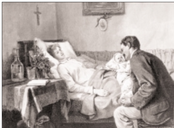
5. ábra. Straka: Az újszülött. Über Land und Meer, 1892. 9.

A századforduló táján az apa alakja mind többször megjelenik a társasági lapok meg-hitt családi kört ábrázoló képein is. Magyarországon e témakörben jól kimutatható a korabeli német illusztrált folyóiratok hatása: