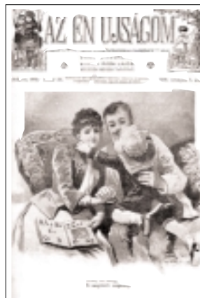
6. ábra. Az én Ujságom, 1903. 8.