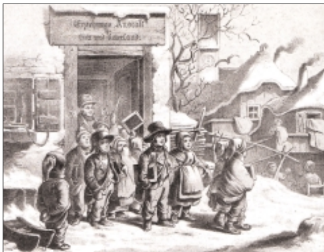
3. Oskar Pletsch: Nevelőintézet, 1858

arckifejzésű fiúk) és kész „gazdasszonyok” (köténybe és kendőbe öltöztetett lányok) lépnek ki, akiknek nevelése-képzése már befejeződött. Semmi gyermekies vonás nincs ezeken az alakokon. Felnőttek ők, akik készen állnak az élet megpróbáltatásaira: