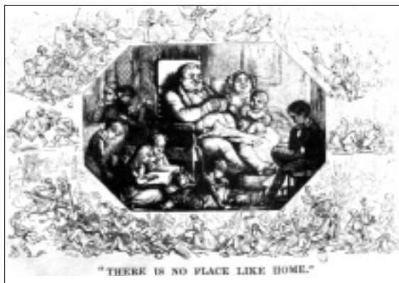
1. ábra. „Az otthonnak nincs párja” – Richard Doyle karikatúrája a Punch című londoni lapban, 1849

Bizonyos körökben a nők gazdasági természetű háttérbe szorítása a század folyamán csak fokozódott. Polgári családoknál korábban még gyakran előfordult, hogy asszonyok kereskedő vagy kézműves férjeik mellett részt vállalhattak az üzlet vezetésében úgy, hogy könyvelést vezettek, titkárnői, eladói szerepet tölthettek be stb. A munkahely azonban a század folyamán fokozatosan eltávolodott az otthontól, a műhelyek, manufaktúrák, boltok többnyire már nem a lakóépületben vagy annak közelében kaptak helyet. Ez a folyamat a polgárosodással párhuzamosan zajlott le. Az egyre tehetősebb gyárüzem-tulajdonosok például már nem viselték el az iparnegyedek szennyét, a füstöt, amelyet saját gyáruk bocsátott ki. Így inkább a belvárosban béreltek lakást, vagy az új lakónegyedekben építettek villát családjuknak. Az otthon és a munkahely így fokozatosan elvált egymástól, a „privátszféra” elkülönült, s a nők szerepe – a korábbiaknál is jobban – korlátozódott, feladatuk a családi fészek nyugalmának, harmóniájának biztosítása lett.