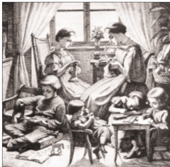
2. ábra. Bürkner: Gyermekbútorok, 1868

A tizenkilencedik század elejének biedermeier stílusa rányomta bélyegét e szoba bútorzatára is. A következő képen egy ilyen idealizált gyermekszobát látunk: