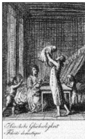
Daniel Chodowiecki: Házi örömei

A képen ábrázolt jelenetben mindenki megtalálta a helyét. A tetőről lekanalikáló angyalok egy boldog, kiegyensúlyozottan harmonikus családot látnak, amelyben a nagymama megelégedett, a szülők gondoskodóak, a gyerekek jól neveltek, s még a háziállatok is teszik a dolgukat. Kiszámítható a gyerekek jövője is: ugyanolyan egyszerű, megbízható és becsületes kispolgárrá fognak válni nagykorukra, mint most szüleik. Zökkenőmen-