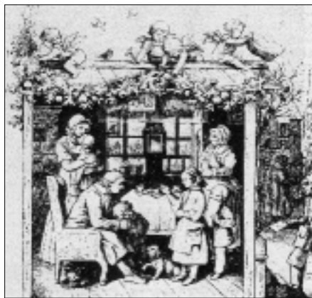
Ludwig Richter: Újévi üdvözlés (1862)

Ha még egy pillantást vetünk e két illusztrációra, akkor észrevehetjük, hogy az apa mindkét képen központi alakként, mintegy „referencia-személyként” jelenik meg: minden tekintet rá szegeződik, a többi szereplő figyelmé felé irányul. Ezek a hétköznapi életből átvett, művészi eszközökkel felerősített gesztusok megerősítik a tételt, amelyet Ludwig Fertig német történész fogalmaz meg. Eszerint az apák a 19. század során ismét fokozott tekintélyre és autoritásra tettek szert, amelynek forrása megnövekedett társadalmi szerepük volt. Az édesapák mint dolgozó polgárok a külvilágban nap mint nap átérték az alá-fölérendeltségi viszonyok megerősödését, s – akár munkaadók, akár munkavállalók voltak – a családban is ezt a hierarchiára törekvést képviselték. Gyerekeiktől való távolodásukat fokozta, hogy dolgozó apaként kereső foglalkozásuk színtere ekkor már általában nem a családi ház volt. A távollevő apa figurája így olyan értékek hordozójává lett, mint a fegyelem, a rendettség és a védelem, míg az otthon érzelmi melegségének megteremtésére, a szeretet nyújtására való képesség egyre inkább az anya személyéhez kötődött. ( Fertig, 1984 )