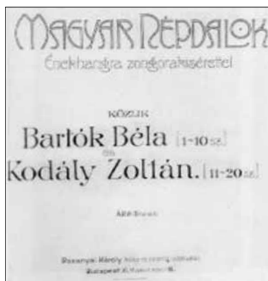
6. ábra. Bartók – Kodály: Magyar népdalok. Címlap, 1906

addig a „magyaros ízt” csak a cigány-, illetve a verbunkos zene motívumai jelentették. A terv megvalósítása nem ment könnyen: 1906-ban még csak óhajként fogalmazódott meg első énekhangra és zongorára feldolgozott húsz magyar népdal felölő gyűjteményének előszavában: „A magyar társadalom túlnyomó része még nem elég magyar, még nem elég naiv és nem elég művelt arra, hogy ezek a dalok közelebb férközzenek a szívéhez. A magyar népdal a hangversenyteremben! – különösen hangzik ma még. Hogy egy sorba kerüljön a világirodalom remekeivel és a – külföldi népdallal. Mikor majd lesz magyar házi muzsika és a magyar család zenélése nem éri be a legalacsonyabbrendű külföldi kupléval, belföldi népdalgári portékával.” (14)