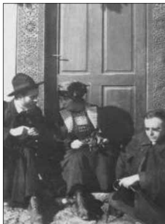
4. ábra. Népdalgyűjtő körúton, Magyarerdőmonostor, 1910-es évek

ra megismerésére, a népdalkincs feltárására, összegyűjtésére, majd tudományos igényű feldolgozására.