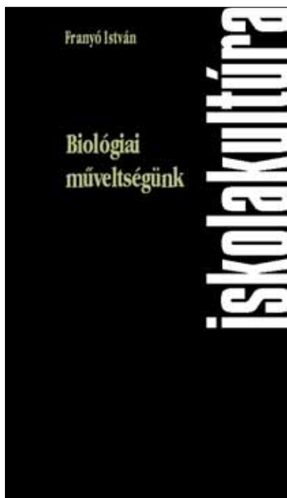
Az Iskolakultúra könyveiből