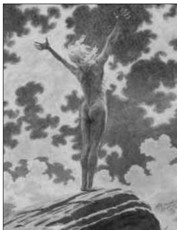
1. ábra. Fidus: Fényfohász (Lichtgebet), akvarell, 1913

Az ilyen kísérletek körébe sorolható egyebek között a természetgyógyászat, a homeopátia és a holisztikus medicina, a vegetarianizmus, a szabadlevegős testkultúra és a természetjárás. Különösen német nyelvterületen terjedt el nudizmusnak az a válfaja (Freikörperkultur, Nacktkultur), amely a szabad levegőn végzett gimnasztikai gyakorlatok révén az ember és természet kapcsolatának újrafelfedezésére törekedve a városias életmód által elgyötört test és lélek megújítását tűzte ki célul. A korabeli életreform-mozgalmakra jelentős eszmei befolyást gyakorolt a festő, alpesi vándor és természetpróféta Karl Wilhelm Diefenbach és tanítványa Hugo Höppener , művésznéven Fidus . Ez utóbbi legismertebb műve a 'Fényfohász' (Lichtgebet) című kép, amelyen a Nap felé forduló mezítelen férfi alakot látható. Ez az alak és ez a fény felé kitért karral feltárulkozó gesztus a kor ifjúsági reformmozgalmainak vált újra és újra felbukkanó, szinte emblematikus jegyév.