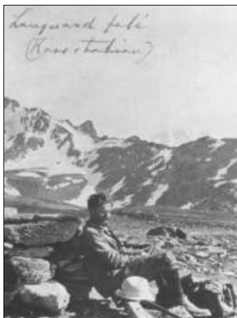
2. ábra. Pihenő Svájcban (5)

hegyi túsíjakra: az első világháborúig sokat barangolt nyaranta a svájci Alpokban. (Feltehetően az itt gyűjtött élményanyag is hozzájárult a „Hegyi éjszakák” című, női karra írt kórusművének megszületéséhez.)