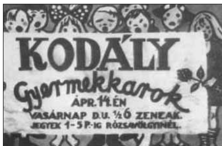
7. ábra. Az első „gyermekkari est” plakátja

Három évvel később, 1928. május 12-én egy zeneakadémiai szerzői est keretei között új kezdeményezésre került sor: a Wesselényi utcai fiúk mellé már három felnőtt kórus is felsorakozott (Palestrina Kórus, Székesfővárosi Énekkar, Budai Dalárda). Közel egy évre rá, 1929. április 14-én pedig páratlan ünnepi eseményre került sor: megrendezték „Kodály Zoltán Gyermekkar-estjét” a zeneművészeti főiskola nagytermében, ahol hét pesti iskola mintegy hétszáz tanulója tizenhárom kórusművet adott elő. A siker elementáris erejű volt, a kritikusok a magyar zenei élet „aranybetűs” ünnepeként dicsérték az új kezdeményezést.