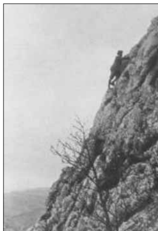
3. ábra. Hazai tájakon

A vadregényes hegyvidék iránti vonzódás Kodály esetében több volt felüdülést nyújtó időtöltésnél: edzést, fizikai felkészülést jelentettek ezek a túrák az élethivatásként választott zenei „túrák”-ra, azaz a népdalgyűjtő körutakra. A zeneszerző-zenetudós 1905-től kezdve 1950-ig csaknem húsz nagy népdalgyűjtő úton vett részt. Könnyű belátni, hogy ehhez a munkához nem volt elegendő a magas szintű zenei képzettség. Egy íróasztal vagy hangszer mellett ülő, négy fal közé kényszerített életmódhoz szokott zeneművész különleges előkészület nélkül nem lett volna képes ezekre az erőpróbára. Kiváló fizikai kondícióra, állóképességre is szüksége volt Kodálynak ahhoz, hogy újra és újra felkerekedve fáradhatatlanul vándoroljon faluról falura a történelmi Magyarország vidékein azért, hogy addig ismeretlen magyar és szomszédos népektől származó dallamokat rögzítsen fonográfjával.