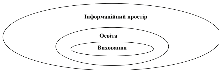
Рис. 2. Модель єдиного інформаційно-освітньо-виховного простору

Серед основних вимог до формування єдиного інформаційно-освітньо-виховного простору міста на основі партнерських взаємовідносин соціально-економічних інституцій треба визначити такі: