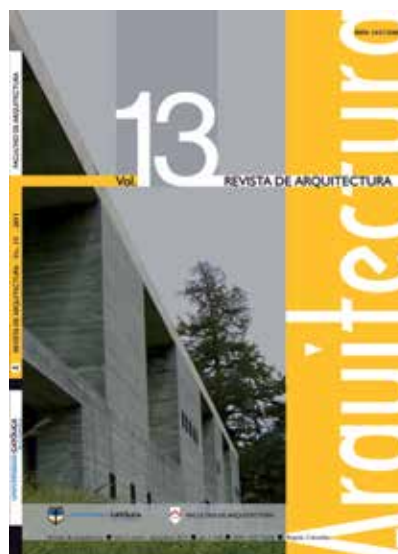
Figura 2. Volumen 13 de la Revista de Arquitectura

La sección de “Cultura y espacio urbano” ha sido orientada por las miradas sobre temas como imaginarios y representaciones sociales e historia urbana. “Proyecto arquitectónico y urbano” ha ocupado mayor protagonismo y se pueden destacar diferentes frentes de acción, como la historia y la crítica arquitectónica, la construcción del proyecto como problema formal, espacial y social, así como la pedagogía y la didáctica en la arquitectura.