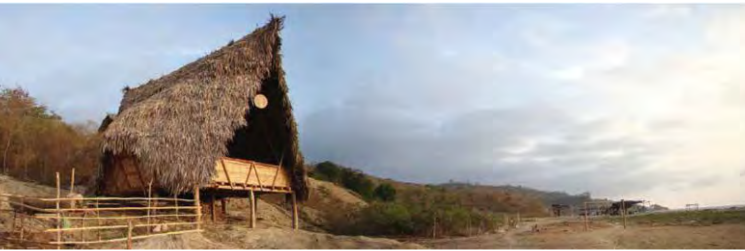
Figura 7. Escuela Nueva Esperanza I-II. El Cabuyal, Ecuador

cuestiones: una, la imprevisibilidad en la respuesta del usuario frente a la arquitectura que se le propone; el arquitecto hace una hipótesis sobre una conducta prototípica semejante a la que él como profesional de la arquitectura asumiría, erigiéndose de esta manera en un prototipo más utópico que antropológico de la sociedad. La segunda cuestión tiene que ver con la importancia de estudiar y analizar no solo las necesidades, sino las esencias culturales de las comunidades objeto de la arquitectura y el urbanismo, lo que pone de manifiesto la importancia de la arquitectura participativa como método, y revela su principal característica: la de actuar como mecanismo vinculante entre arquitecto y comunidad, buscando un equilibrio, un diálogo y, sobre todo, un entendimiento entre las partes, lo que deriva en la última de las tres tendencias identificadas para el caso de la arquitectura participativa.