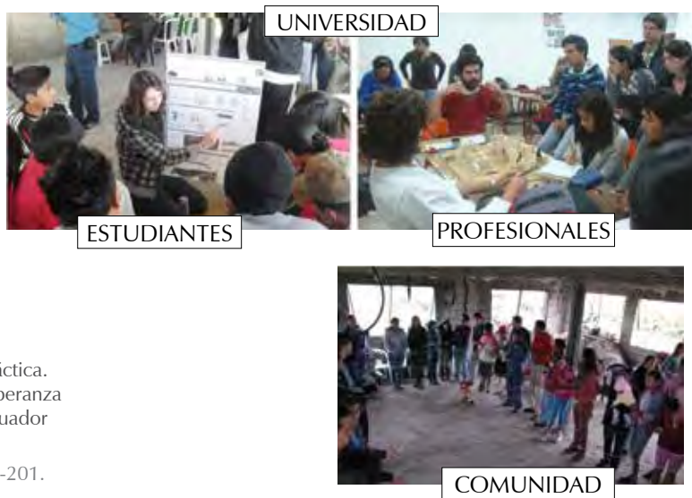
Figura 8. Interacción práctica. Escuela Nueva Esperanza I-II. El Cabuyal-Ecuador