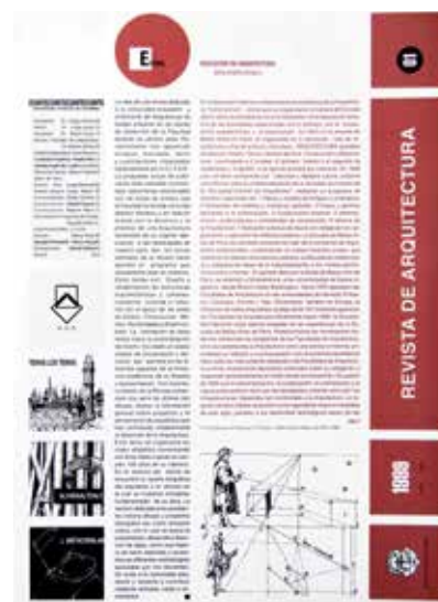
Figura 1. Primer número de la Revista de Arquitectura

A partir de las convocatorias para postulación de artículos, y en los últimos volúmenes publicados, se pueden detectar tendencias de investigación en las cuales el tema urbano y el proyecto son dominantes, aunque el primero ha disminuido su participación.