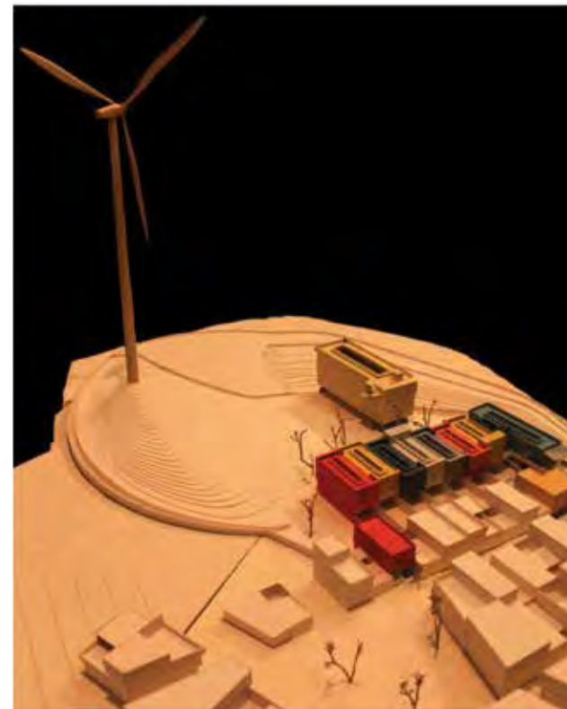
Figura 9. Casa de valores. Bogotá, Colombia

Por todo lo anterior es posible afirmar que el poder de la arquitectura participativa no reside en la capacidad de transformar lugares y espacios, sino en un poder aun mayor: el de actuar e influir en el imaginario colectivo de personas y comunidades, una influencia que alcanza la esfera del inconsciente colectivo, y logra consolidar en un único elemento arquitectónico un basto universo de ideas, deseos, estéticas e intenciones pertenecientes no solo a un arquitecto, sino a toda una comunidad.