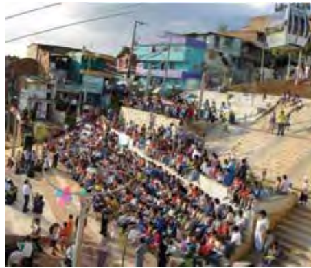
Figura 5. Presencia de la arquitectura participativa en publicaciones y eventos, y en la comunidad