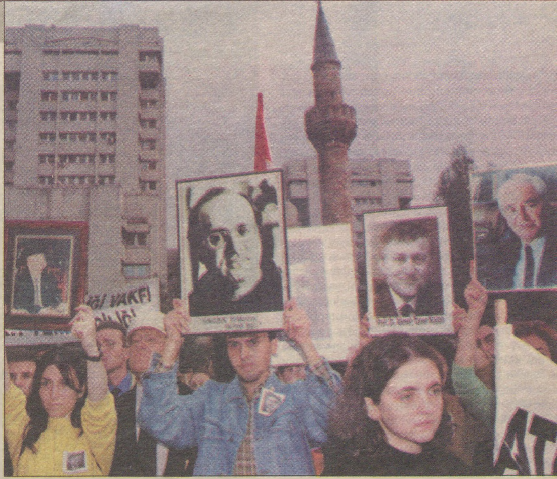
Acıyı paylaşmaya çalıştığımız 23 Ekim 1999 günü...