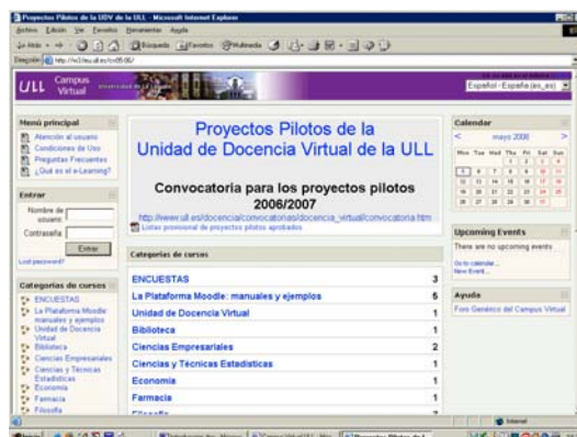
Figura 2. Nueva versión del Campus Virtual ULL (2006)

En el curso siguiente (2006-07) se volvió a realizar dicha convocatoria de proyectos piloto 4 para la docencia virtual procediéndose a abrir un nuevo espacio virtual para alojar dichas aulas. Este campus virtual era similar al creado el curso anterior (véase Figura 2) ya que también estaba desarrollado bajo la plataforma MOODLE y administrado por el mismo equipo técnico perteneciente a la Fundación Universidad-Empresa. Se crearon un total de 141 aulas virtuales.