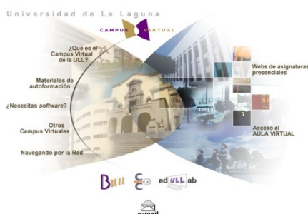
Figura 1. Versión inicial del Campus Virtual de la ULL (2001)

cos. Una descripción más detallada de esa primera versión del campus virtual de la ULL puede consultarse en Area et al. (2002).