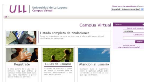
Figura 4. Versión actual del Campus Virtual de la ULL (2008)

Al comienzo del curso 2007-08 se abre una nueva etapa en campus virtual de la ULL. El servidor deja de estar alojado y gestionado por la FUE para ser asumido por la Unidad de Docencia Virtual (UDV). Asimismo se cambia la interface del CV (ver Figura 4), y se oferta la creación de nuevas aulas virtuales más allá de las específicamente abiertas para la convocatoria de proyectos piloto de docencia virtual.