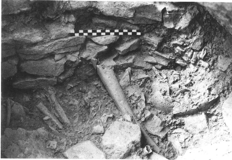
Foto 3. Detalle del murete de sillarejo en el interior de la cámara. Restos humanos (agosto 1991).