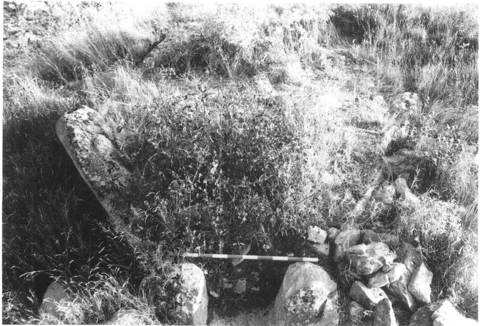
Foto 1. Aspecto del megalito antes de la intervención (agosto 1989).