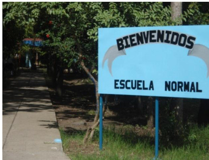
Entrada principal de la escuela normal.