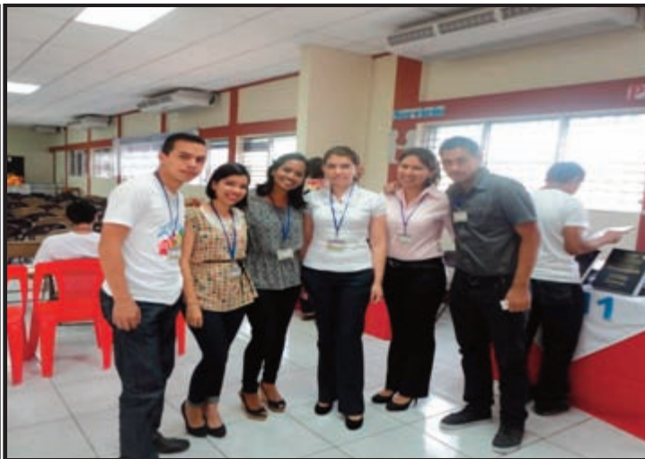
Movimiento de Emprendedores de la FAREM - Carazo