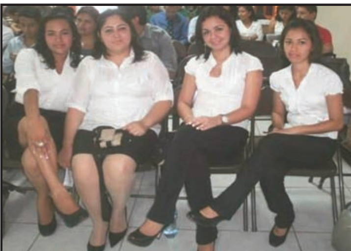
Equipo No.1. Idea de Negocio: Fertilizante Orgánico