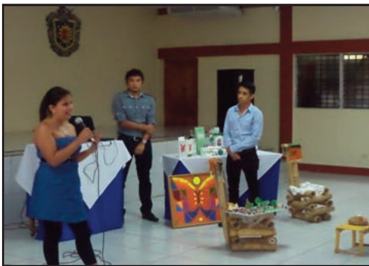
Equipo No.13. Idea de Negocio: Tour Operadora