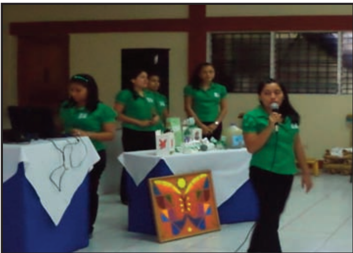
Equipo No.10. Idea de Negocio: Eco recycle

En la competencia de Innovación y Emprendedurismo participaron 16 equipos con ideas de negocios enfocadas en categorías como: Producción, Servicio, Desarrollo Tecnológico, Agroindustria y Turismo, que se destacan a continuación: