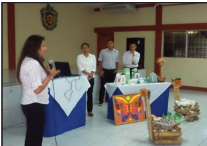
Equipo No.16. Idea de Negocio: Servicio de café Karaoke