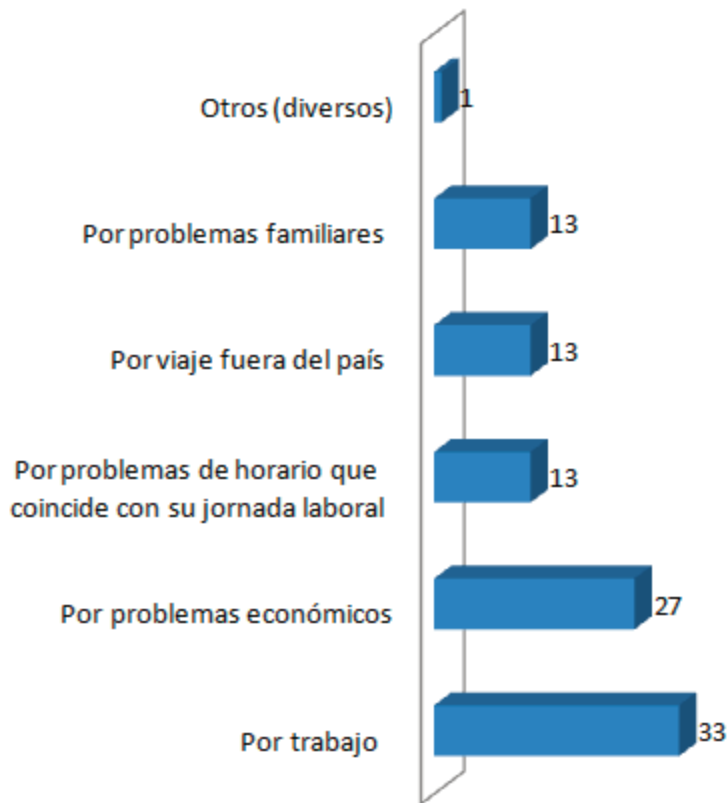
Motivos de deserción de los estudiantes en orden de prioridad