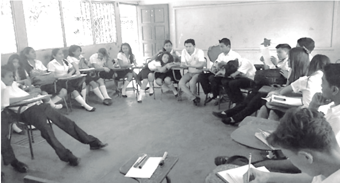
Figura 4: Estudiantes participando en conversatorio

entre estudiante y docente se vuelve determinante. Al respecto Pérez (2009) expresa que en la concepción constructivista de la práctica docente, “alumnos y maestros se convierten en sujetos que construyen el conocimiento, mediante sus interacciones” (p. 33).