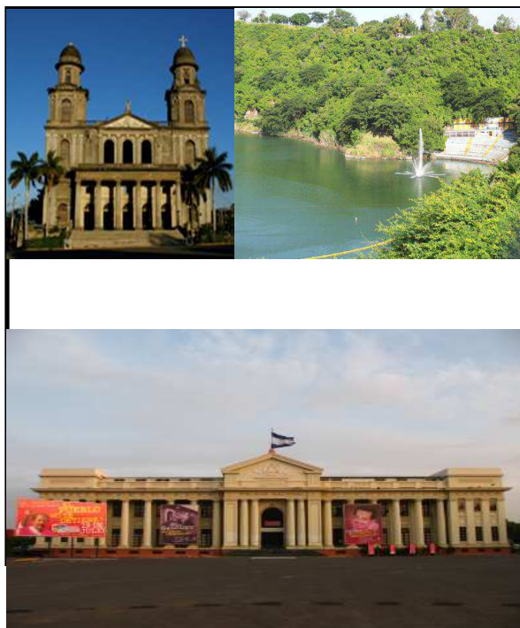
Imagen 1: vista de los sitios de Managua.

Además posee playas occidentales de fácil acceso, con hoteles y restaurantes en la ciudad con lujosas estructura que proveen confort y estabilidad a los visitantes, la modernización de esta ciudad fue a partir de los años 2000 con mayor incidencia en el 2007, todo ello ha favorecido al crecimiento del sector turístico en la región. Algunos sitios modernizados son el puerto Salvador Allende, La Avenida Bolívar, La Catedral de Vieja, el Palacio de la Cultura