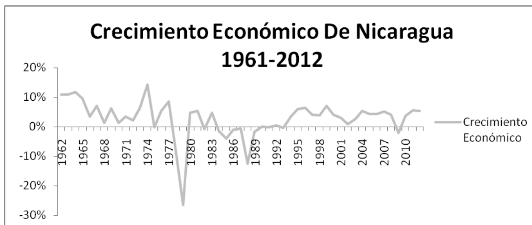
Gráfico N0. 1