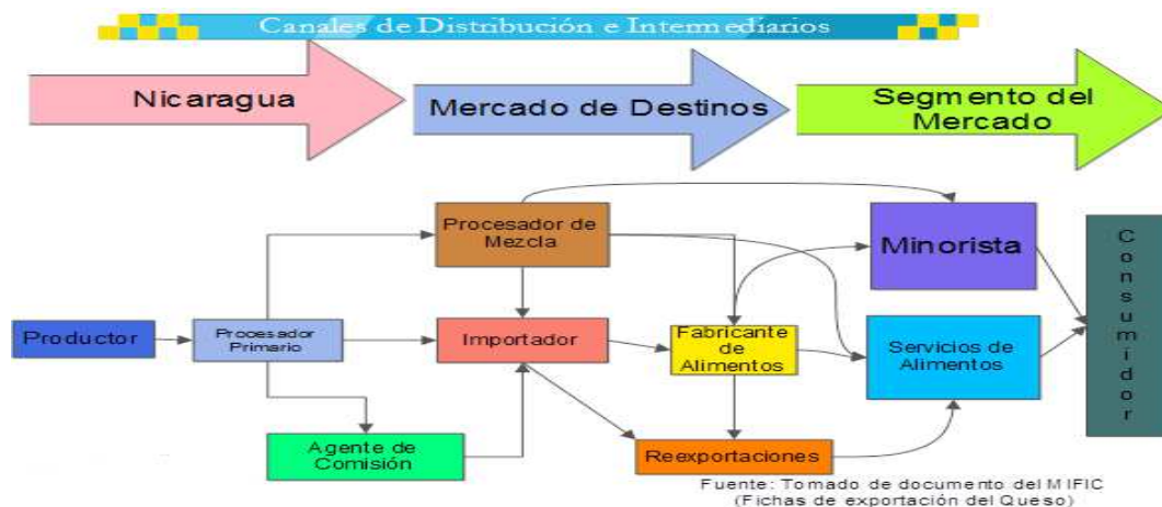
Ilustración 2 Cadena de comercialización mercado externo

Agentes de Comisión: se están volviendo menos común, estos buscan compradores de los mercados de destino, tienden a ser importadores, ellos cuentan con el conocimiento requerido como un intermediario para vender productos de países en vías de desarrollo.