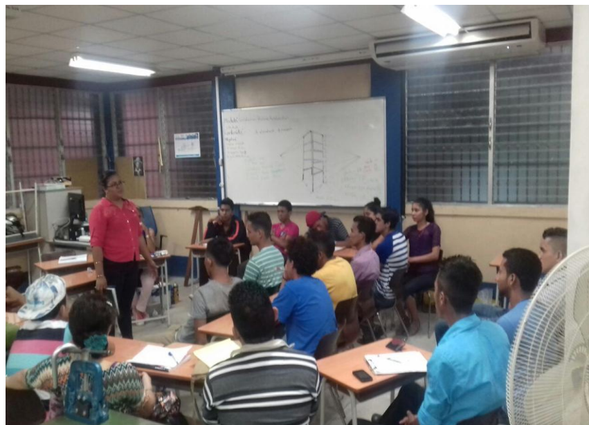
Estudiantes de Educación Técnica de todos los cursos en Consejo Estudiantil