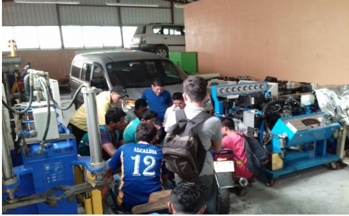
Estudiantes de Primer año