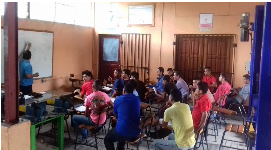
Estudiantes de Segundo año