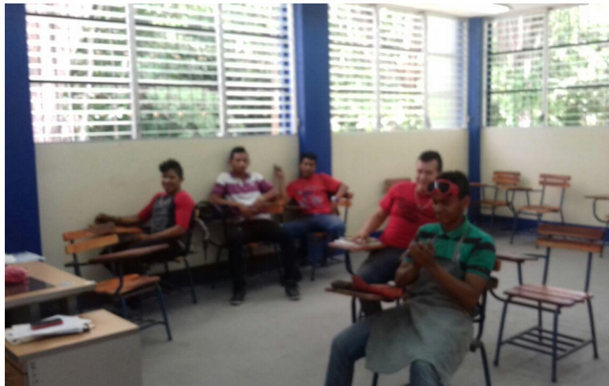
Estudiantes del primer año del Técnico General en Corte y Soldadura