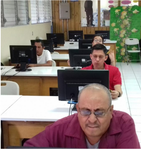
Docentes de Educación Técnica de las Diferentes especialidades