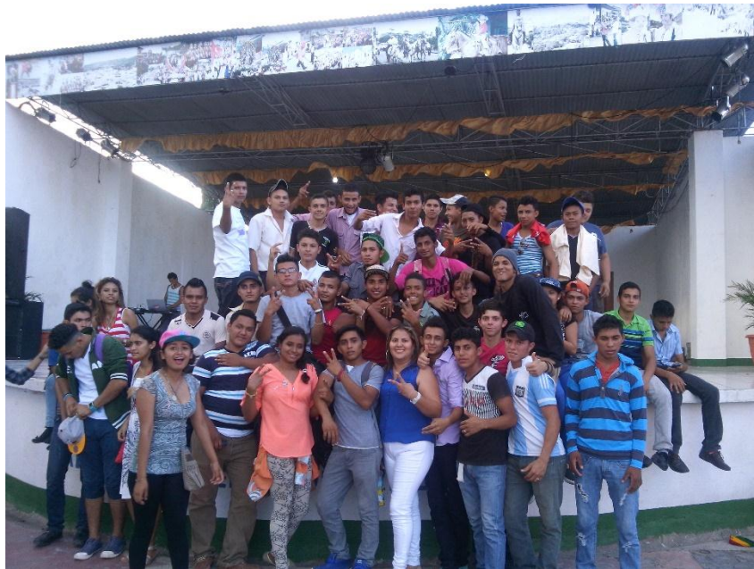
Estudiantes de Educación Técnica de todos los cursos en Actividades de Recreación