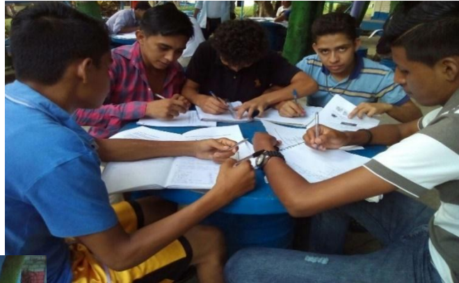
Estudiantes de primer año del Técnico General en Mecánica Automotriz