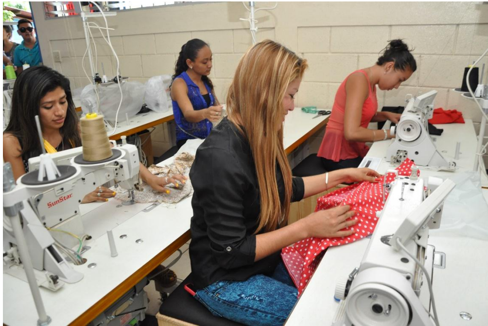
Estudiantes del Técnico General en Diseño, Corte y Confección