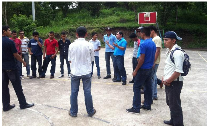
Estudiantes de Tercer año