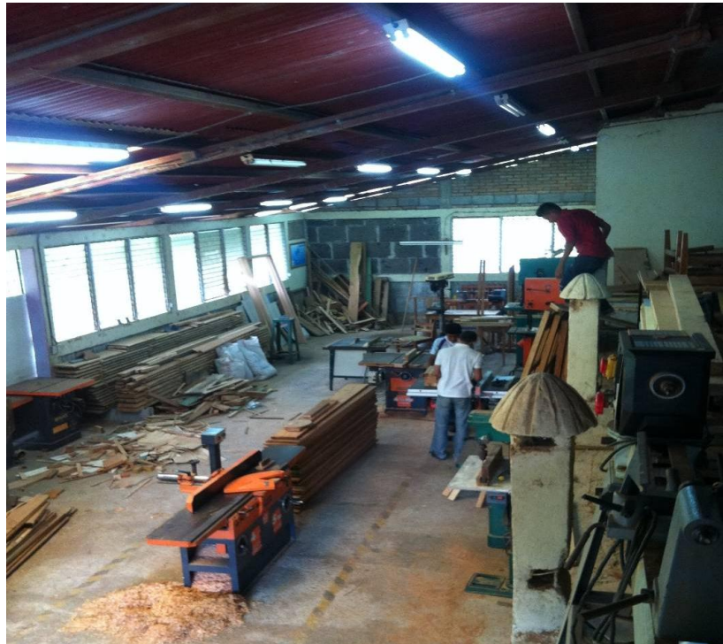
Estudiantes de segundo año del Técnico en Ebanistería