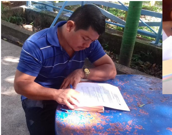
Docentes al momento del llenado del cuestionario