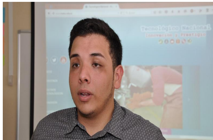
Director del centro