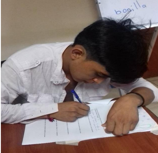
Estudiantes al momento del llenado del cuestionario