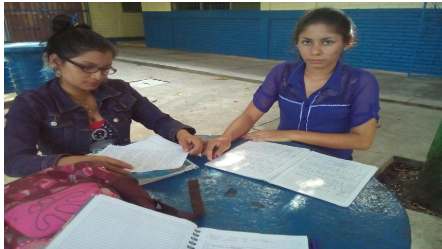
Estudiantes de segundo año del Técnico General en Diseño Corte y Confección