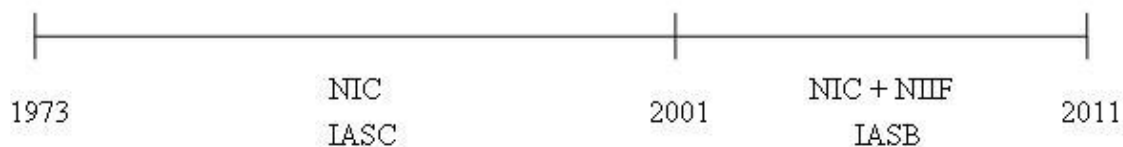
Figura 2. Periodo de las normas contables. Wikipedia (2010).