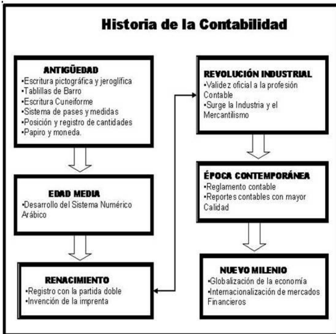
Figura 1. (Gallo, P. Universidad, 2013). Origen y evolución de la contabilidad.