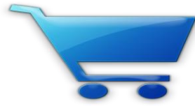
Figura No.3. Añadir carrito

Las órdenes que no se completan representan un serio problema en el marketing online. Por esta causa, empresas de todo el mundo pierden varios millones de dólares al año.