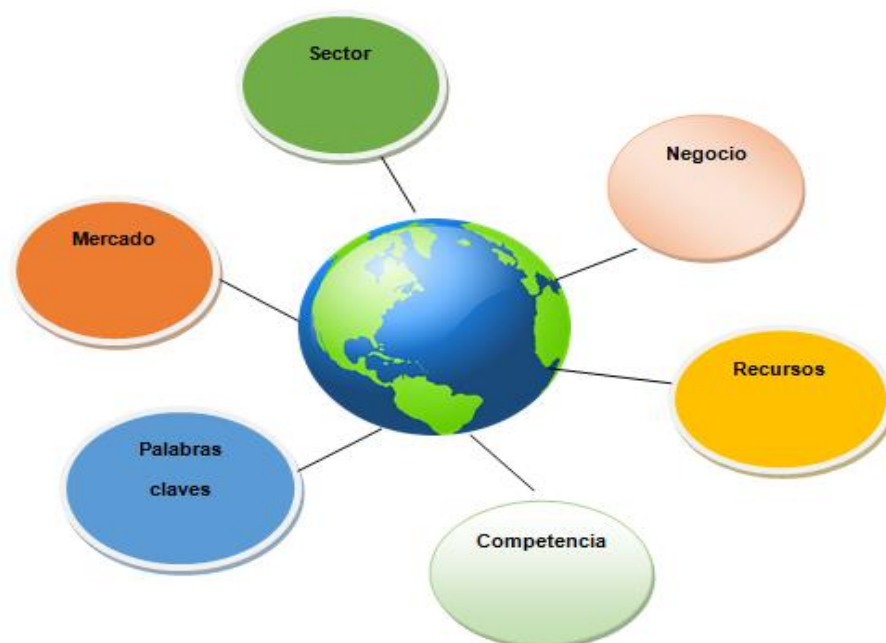
Figura No. 2. Estudio de mercado.

(Kotler, 2004) Supone un análisis externo de la empresa, de su entorno y del sector al que pertenece. No es imprescindible, aunque si recomendable, para poder segmentar el mercado y para obtener información sobre un sector concreto.