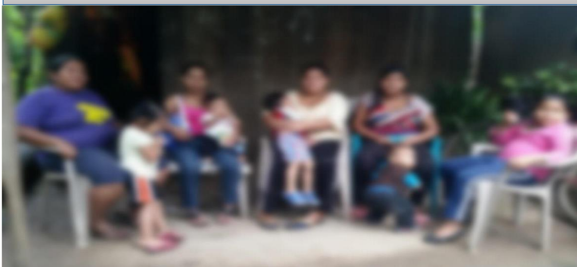
Imagen N° 5: Mujeres Entrevistadas