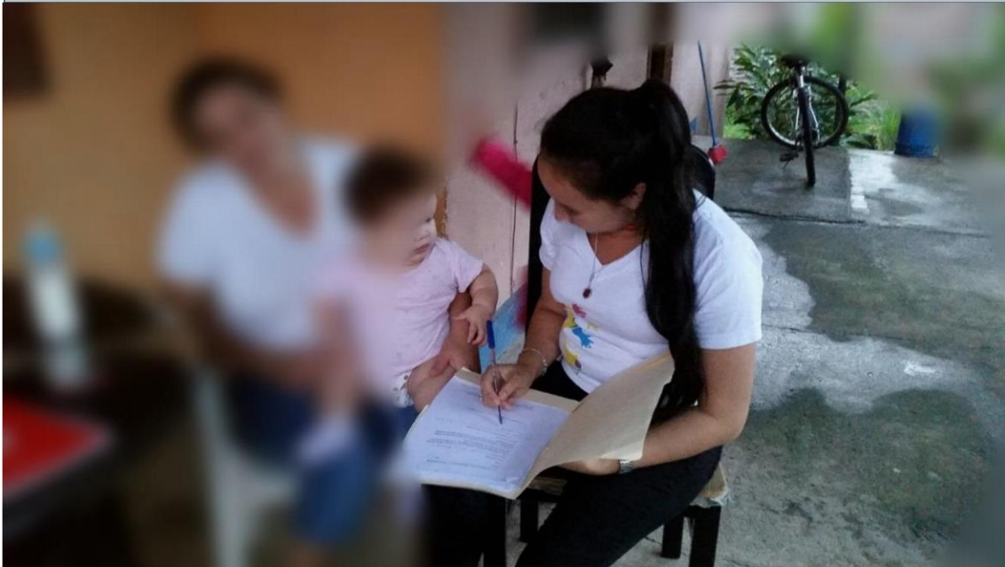
Imagen N° 4: Desarrollo de entrevista a una de las participantes

Fuente: Jaqueline Blandón, investigadora, octubre 2016