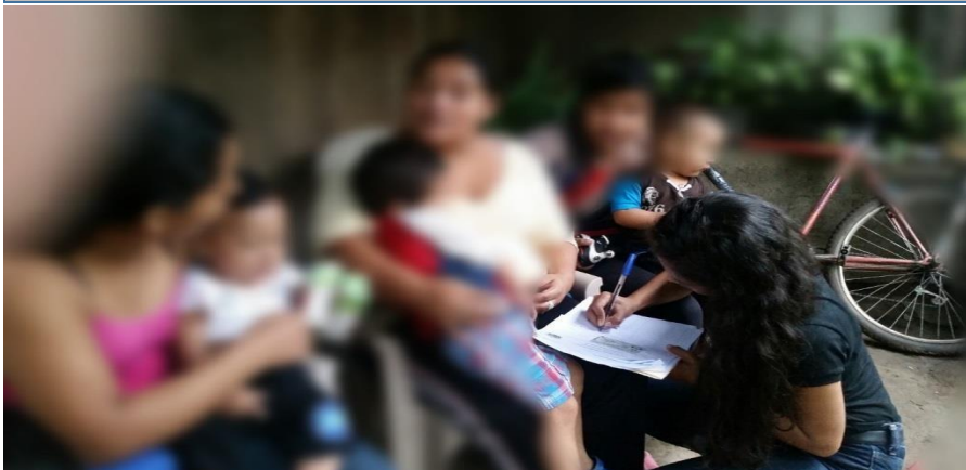
Imagen Nº 3: Levantamiento de asistencia para el desarrollo de entrevistas.