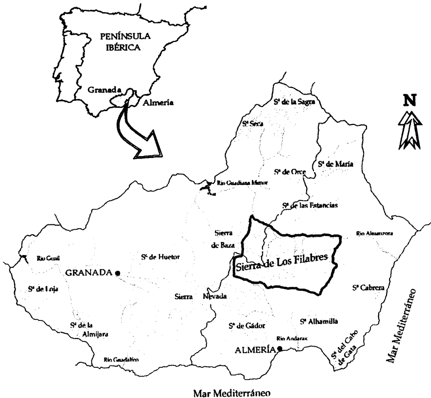
FIG. 1. Localización de la sierra de Los Filabres en el SE ibérico.

La sierra de Los Filabres es un gran macizo montañoso ubicado en el SE de la Península Ibérica, enclavado principalmente en la zona central de la provincia de Almería y con una ligera penetración en la de Granada (figura 1). Hasta el momento, ha quedado al margen en la mayoría de los estudios botánicos y fitosociológicos realizados en el sur peninsular, siendo sin embargo una importante encrucijada biogeográfica (PEÑAS & al. , 1994). En relación con los pastizales terofíticos, se presentan interesantes endemismos y especies de área reducida que con-