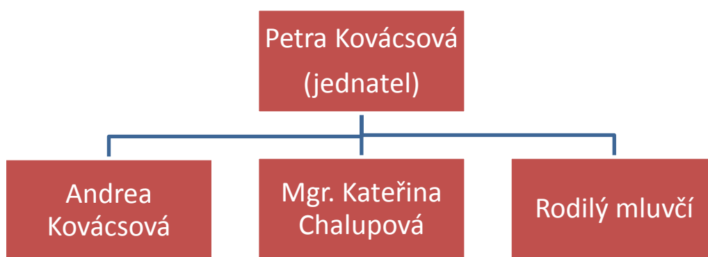
Schéma č. 3.1. Organizační struktura společnosti Brána jazyků, s. r. o.