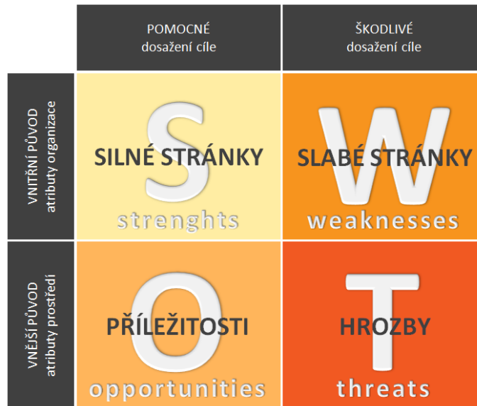
Obr. 2.1. SWOT analýza

Zdroj: http://www.sunmarketing.cz/nastroje/slovník/swot-analyza 30.4. 2014