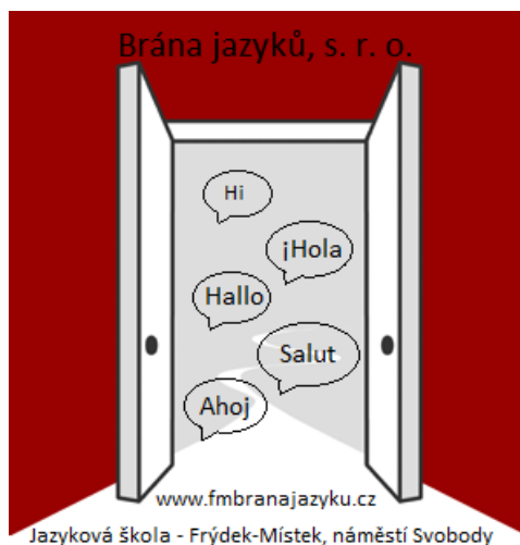
Obr. 3.1. Logo společnosti