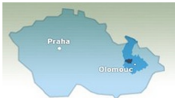
Obrázek 3. 1 – Poloha Mikroregionu Litovelsko