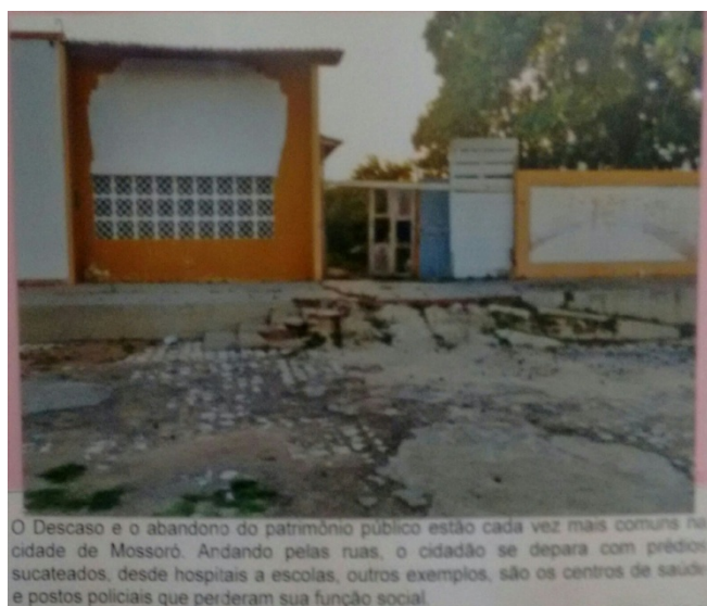
(Imagem produzida por alunos do Ensino Médio)