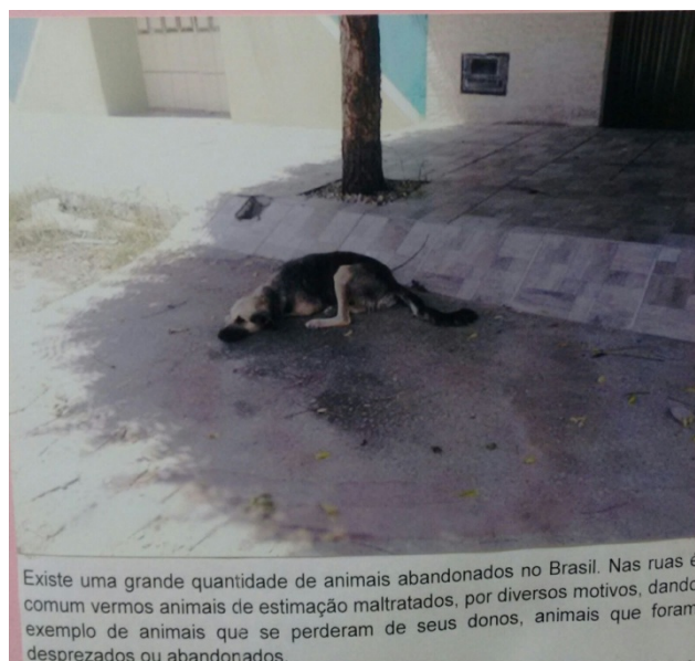
(Imagem produzida por alunos do Ensino Médio)