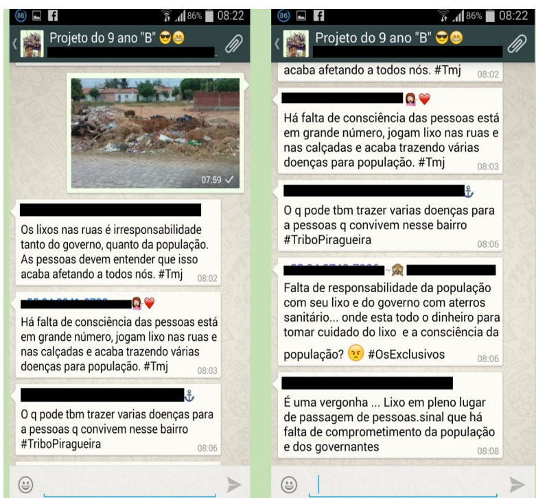
(Imagem e comentários produzidos por alunos do Ensino Fundamental)

Entre as temáticas sugeridas pela professora, está a Consciência Ambiental. Ao registrar imagens de lixo jogado nas ruas da cidade, os alunos se posicionam em relação a essa situação. Pode-se ver que há uma certa indignação com o fato de as pessoas não se importarem com o ambiente e contribuírem com a sua poluição. Há uma consciência cidadã e política se desenvolvendo e se manifestando nos dizeres dos alunos, como em “ Os lixos nas ruas é irresponsabilidade tanto do governo, quanto da população. As pessoas devem entender que isso afeta a todos nós ” e “ Falta de responsabilidade da população com seu lixo e do governo com aterros sanitários... onde está todo o dinheiro para tomar cuidado do lixo e a consciência da população? ”. Percebe-se a criticidade dos