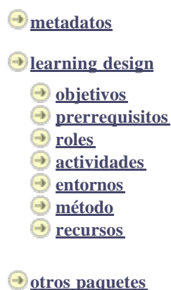
Figura 4. Visualización de los metadatos y componentes de las UA

Por otra parte, si estas unidades ya se encuentran diseñadas con el lenguaje de modelado educativo LD [6] se dará la posibilidad de ver cada uno de los componentes de este lenguaje tal como muestra la figura 4.