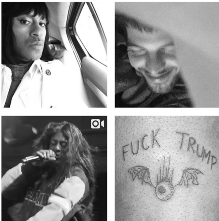
Abbildung 12: Beispielbilder vom Instagram-Profil von Mykki Blanco