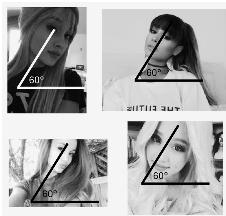
Abbildung 10: Beispielbilder vom Instagram-Profil von Ariana Grande (mit Winkel)

Quelle: arianagrande. https://www.instagram.com/arianagrande/?hl=de (Zugriff: 01. Februar 2017).