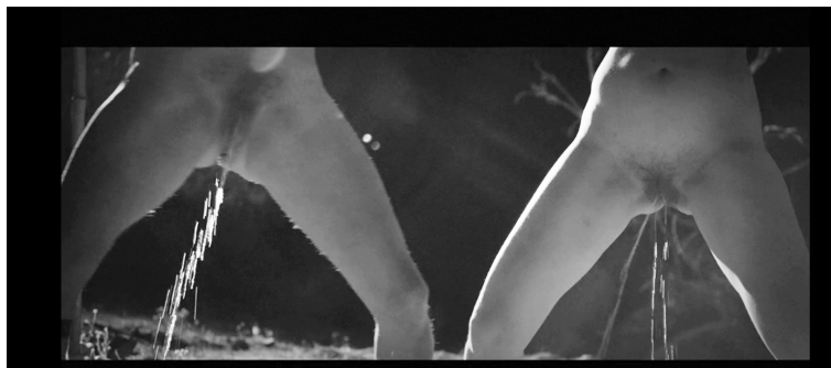
Abbildung 7: Peaches – „Rub“ (2015), Screenshot