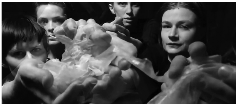
Abbildung 9: Jenny Hval – „Female Vampire“ (2016), Screenshot