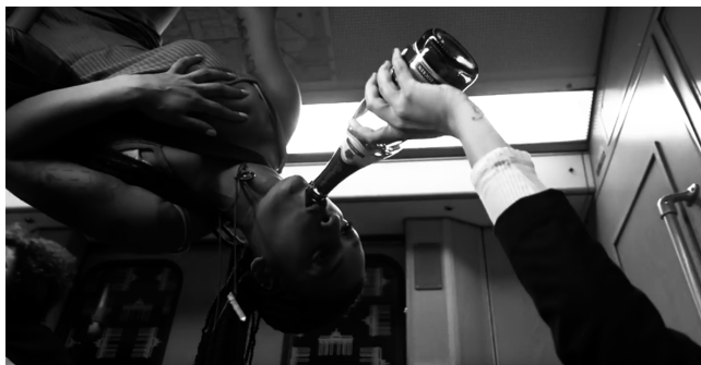
Abbildung 8: SXTN – „FTZN IM CLB“ (2016), Screenshot