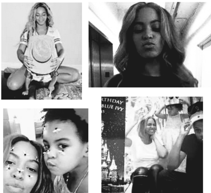
Abbildung 11: Beispielbilder vom Instagram-Profil von Beyoncé Knowles

Quelle: beyonce. https://www.instagram.com/beyonce/?hl=de (Zugriff: 01. Februar 2017).