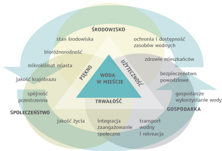
Rysunek 2. Oddziaływanie ekosystemów wodnych na środowisko, gospodarkę i społeczeństwo

Ekosystemy wodne pełnią wiele istotnych funkcji na terenach zurbanizowanych i priorytetowym działaniem, w świetle zasad zrównoważonego rozwoju, jest właściwe zarządzanie nimi, a także ich ochrona i rekultywacja. Woda w mieście ma bardzo duże znaczenie dla środowiska naturalnego, wpływa na jego stan i zachowanie bioróżnorodności, a także kształtuje mikroklimat na terenach zurbanizowanych (Rys. 2.).