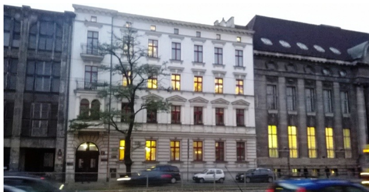
Fot. 8. Budynek przy ul. T. Kościuszki 17 w Łodzi. W części budynku w latach 1994–2004 mieściła się siedziba Katedry Bibliotekoznawstwa i Informacji Naukowej.