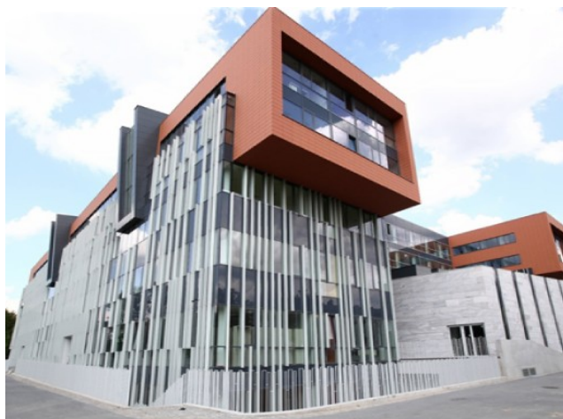
Fot. 10. Siedziba Wydziału Filologicz- nego, ul. Pomorska 171/173 w Łodzi. Tu mieści się Katdra Bibliote- koznaństwa i Informacji Nauko- wej od października 2014.