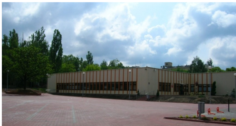
Fot. 9. Budynek przy ul. J. Matejki 34 w Łodzi. Siedziba Katedry Bi- bliotekoznawstwa i Informacji Naukowej w latach 2004–2014.