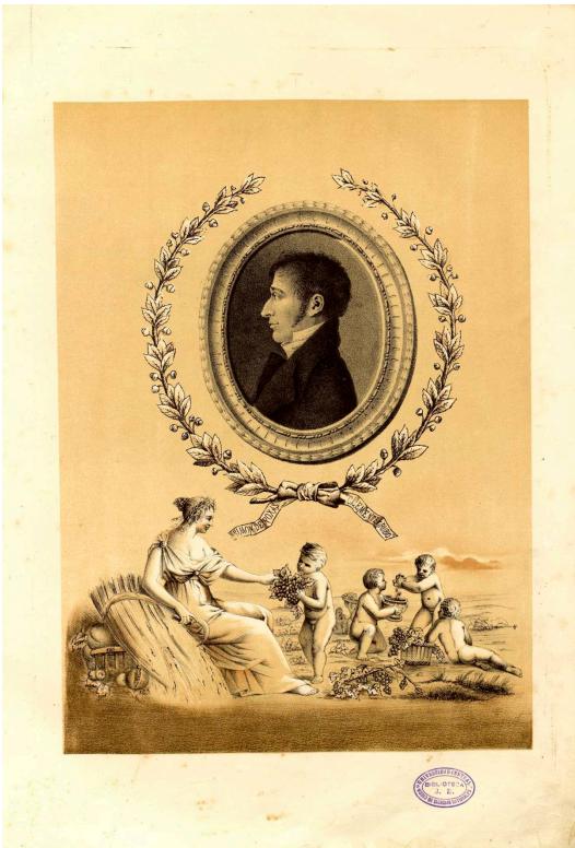
Figura 2. Retrato de Rojas Clemente.