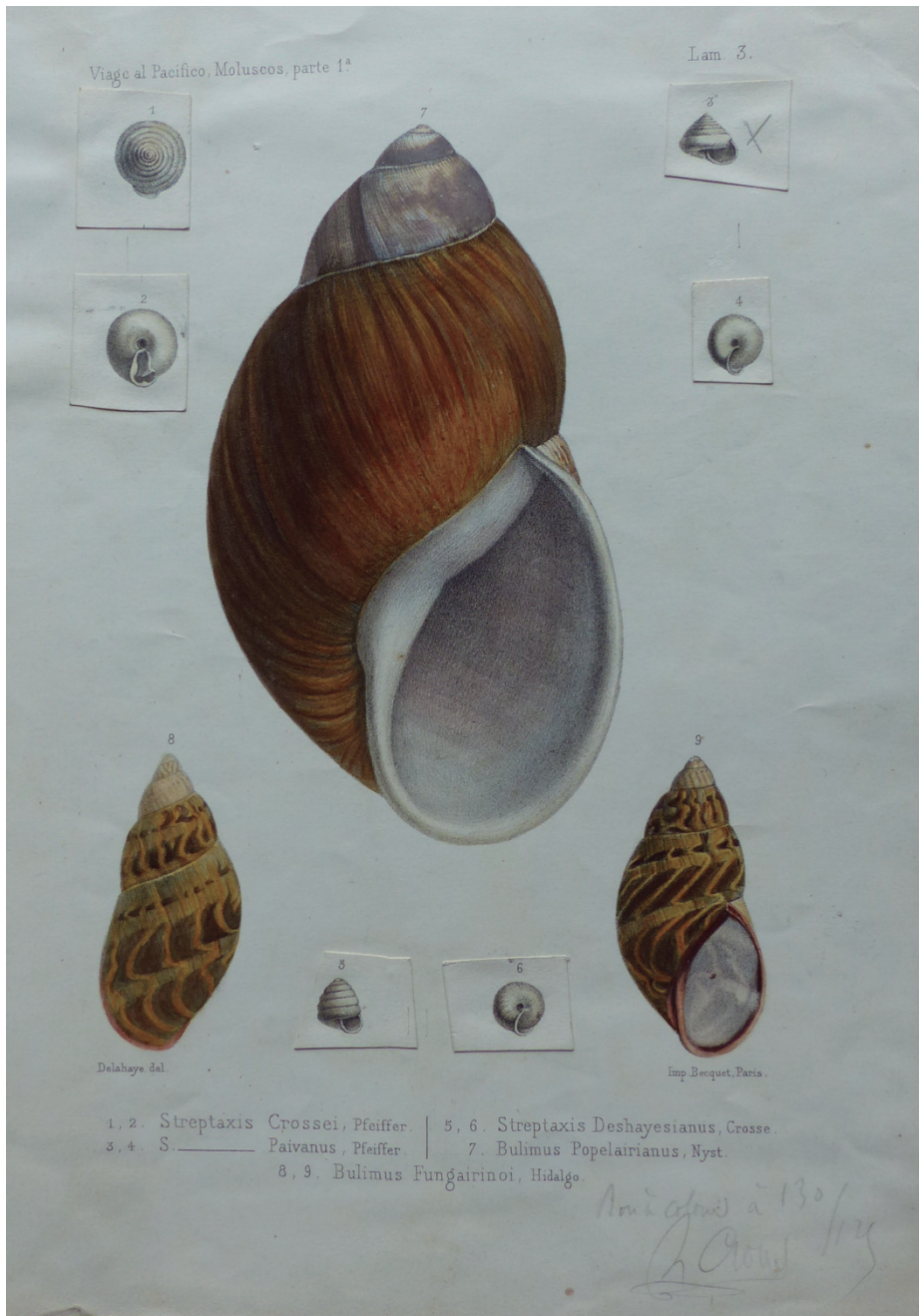
Figure 3. Corrected proof of plate 3 for ‘Moluscos del Viaje al Pacifico, Univalvos terrestres’ (HIDALGO, 1872). In the lower-right corner Crosse has written “Bon à colorier à 130/125 / H. Crosse” (Crosse archive).

Figure 3. Prueba de imprenta corregida de la lámina 3 de ‘Moluscos del Viaje al Pacifico, Univalvos terrestres’ (HIDALGO, 1872). En la esquina inferior derecha Crosse escribió “Bon à colorier à 130/125 / H. Crosse” (archivo de Crosse).