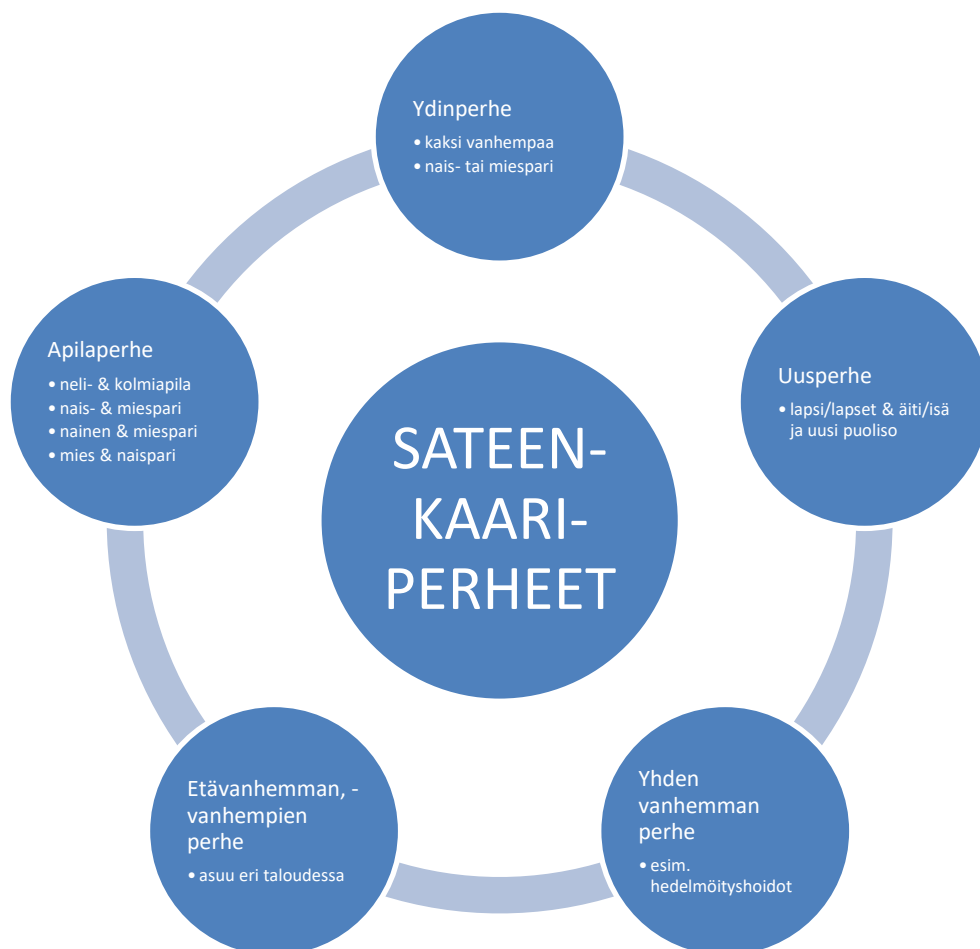
Kuvio 2. Sateenkaariperheiden monimuotoiset rakenteet.

Sateenkaariperheitä on paljon erilaisia, mutta niistä voidaan erotella viisi selkeää perherakennetta. Tyypillisimmät sateenkaariperheet ovat ydinperheitä, uusperheitä, yhden vanhemman perheitä, etävanhemman sekä –vanhempien perheitä tai niin kutsuttuja apilaperheitä (Kuvio 2). Ainoastaan kahdesta tosiasiallisesta vanhemmasta ja heidän lapsistaan koostuvalla perheellä tarkoitetaan ydinperhettä. Ydinperheen muotoiset sateenkaariperheet tulevat usein helpommin tunnetuiksi kuin toisenlaiset sateenkaariperheet, sillä Suomen yhteiskunta sekä palvelujärjestelmä ovat hyvin hetero- ja parisuhdeoletteisia. Ydinperheitä ovat esimerkiksi naisparien perheet, joissa lapsilla ei ole tosiasiallista isää, harvat miesparien perheet, joissa äiti ei ole läsnä lasten elämässä ja useat transvanhempien lapsiperheet, joissa lapset ovat saaneet alkunsa hedelmöityshoidoilla. (Jämsä 2008, 36–37.)