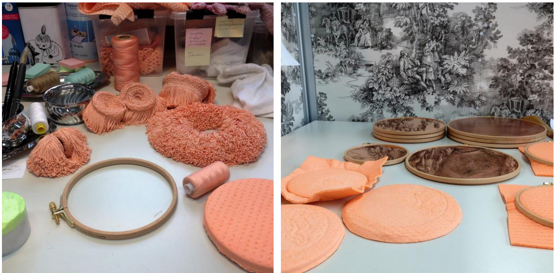
Kuva 9. Koristenauhasta ommellut esineet Kuva 10. Rättikokeiluja

Hapsukoristenauhasta saa ryijyä muistuttavan rakenteen, kun sitä ompelee kerroksittain, joko kehäksi tai ympyräksi (Kuva 9 - 11). Tätä tekniikkaa hyödynnän siitä ompelemissani esineissä (Kuva 9). Väri ja materiaalin koostumus tuovat mieleeni vaginan, mutta samalla ne muistuttavat myös ryijyä ja moppia. Näen esineissä samaan aikaan viittauksen naisen seksuaalisuuteen ja kotitalouteen.