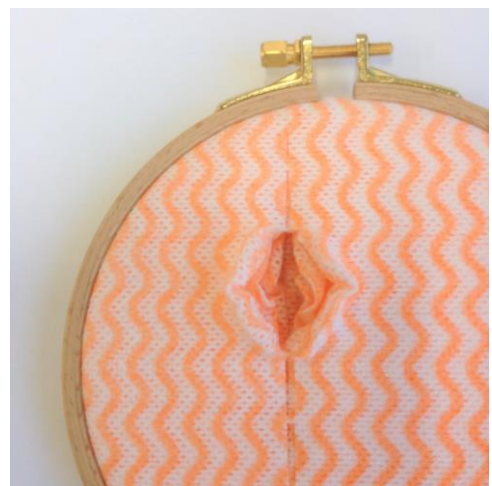
Kuvat 7. Opinnäytetyön osia työhuoneella Kuva 8. Rätistä revitty reliefi