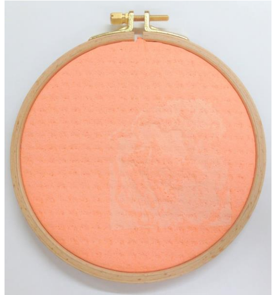
Kuva 5. Kasa erilaisien rätien kanssa tehdyistä kokeiluista Kuva 6. lohenpunaiselle sieniliinalle vedostettu reliefi

Tiskirätissä on mukana myös sen ylitsepääsemätön arkisuus ja tuttuus. Se on materiaali, joka löytyy jokaisen kotoa, mutta suurin osa vain roikottaa sitä epähaluttavana tiskipöydällä. Tiskirätin tehtävä on puhdistaa, poistaa lika, kunnes siitä itsestään tulee likainen haiseva kapistus, josta halutaan eroon. Opinnäytetyössäni tiskirätit ovat puhtaita, käyttämättömiä. Käsitteenä tiskirätti merkitsee minulle puhtautta, mutta sen taustalla on kuitenkin myös lian ja epäpuhtauden aspekti. Siksi mielestäni tiskirätti on paljonpuhuva materiaali liitettynä naisen seksuaalisuuteen ja kaikkeen ristiriitaiseen kaksinaismoraalisuuteen, jota siihen liittyy. Samassa hengessä olen käsitellyt myös kuparia, on puhdasta koskematonta kuparia ja käytettyä, rei'ille syövytettyä kuparia.