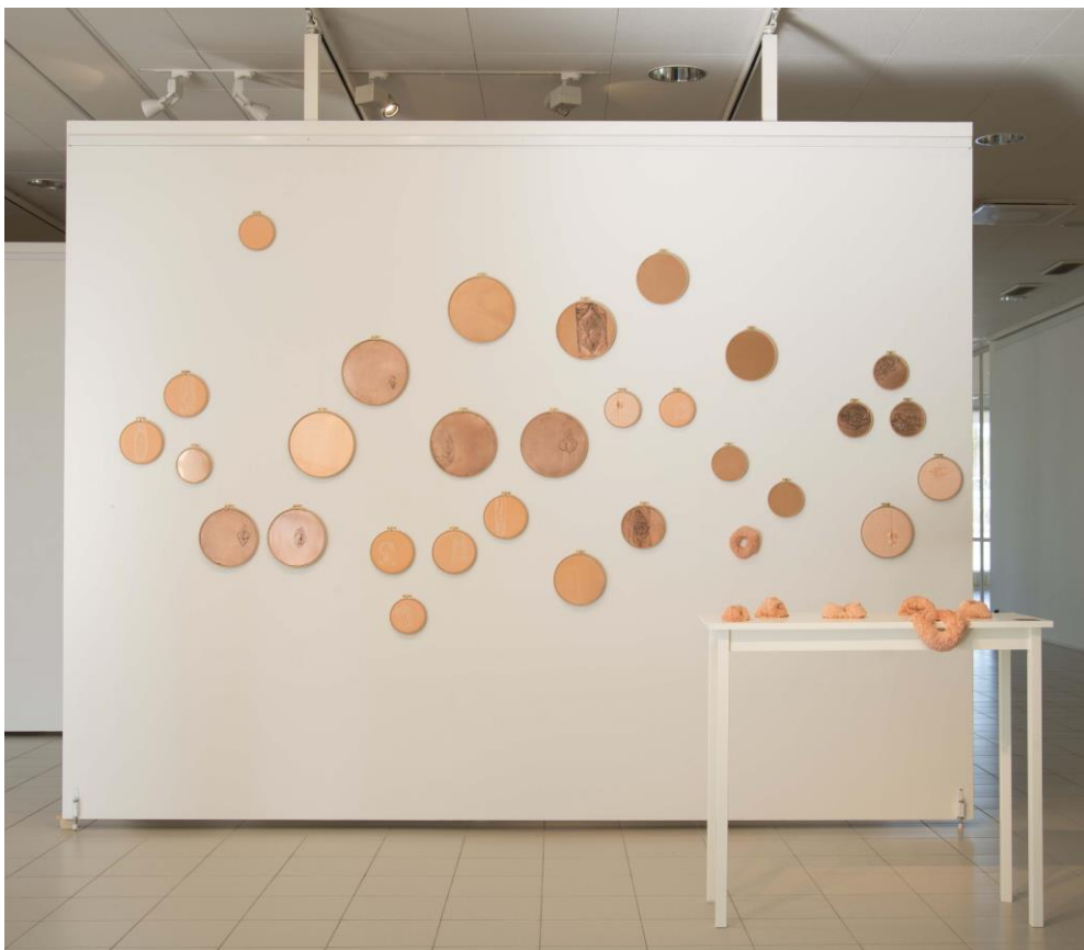
Kuva 13. Pussy Elegance Imatran taidemuseolla

Naisen ja kodin suhde naisen seksuaaliseen rooliin ja seksuaaliseen moraaliin on aiheamaailma, jonka piirissä aion edelleen jatkaa, unohtamatta nykygrafiikan merkityksiä. Olen käsitellyt molempia aiheita opinnäytetyössäni enemmänkin alkuna jollekin suuremmalle, kuin lopputuloksena jollekin. Se näkyy tietynlaisena tutkimuksen ja päätelmien keskeneräisyytenä, joka on ollut osittain tietoisista. Päädyin käsittelemään aihetta laajemmalla skaalalla luodakseni itselleni aineistopohjan, jota lähteä syventämään lisätutkimuksella. Minulle tämä ei ole loppu, vaan alku.