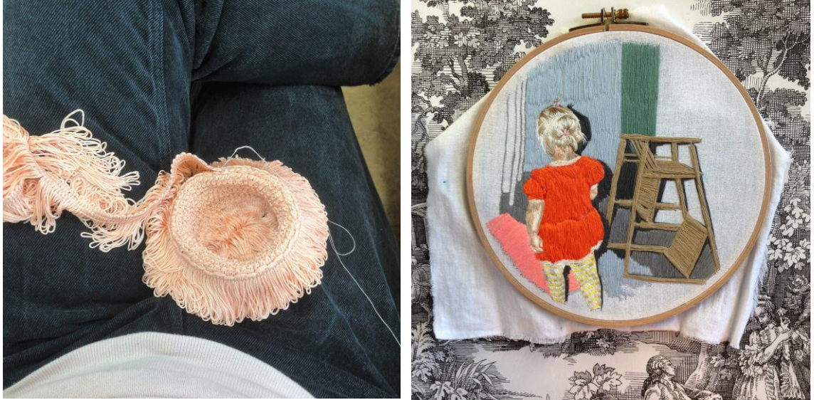
Kuva 11. Tekstiilin kanssa työskentelyä vuonna 2017 Kuva 12. Tekstiilin kanssa työskentelyä vuonna 2013

kee molemmista jännittäviä, jollei jopa kihelmöiviä. On jaksettava sinnitellä loppuun saakka, jos haluaa nähdä lopputuloksen. Kiihko ja jännitys tekevät metalligrafiikan ja tekstiilin menetelmistä minulle vangitsevia.