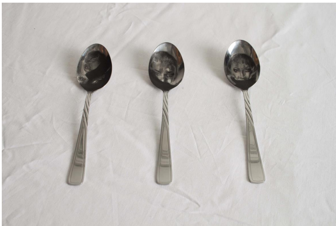
Kuva 2. Kuivaneula lusikoihin vuodelta 2015

Olen kiinnostunut laatan ja vedoksen välisen suhteen dynamiikasta ja sen merkityksestä taidegrafiikassa. Aloitin vuonna 2015 projektin vedostuskelvottomasta grafiikasta (unprintable printmaking) missä hyödynsin metalliesineitä. Lopputuloksena syntyi neljä sarjaa, joissa tein kuivaneulaa ja mezzotintoa tarjottimiin, lautasiin ja leivosvuokiin sekä lusikoihin ja keraamisiin lautasiin (Kuva 2).