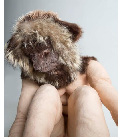
Kuva 3. Tekstiiliveistoksiani vuodelta 2013 Kuva 4. Tekstiiliveistos vuodelta 2016