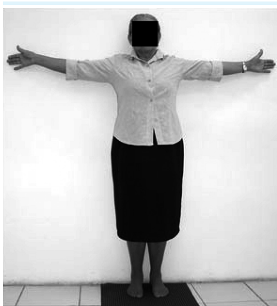
Figura 1: Medida da envergadura

A avaliação antropométrica foi realizada com as voluntárias em pé e descalças. A envergadura mensurada entre a ponta dos dedos médios com as voluntárias em pé e com seus braços abduzidos alcançou 90° (figura 1).