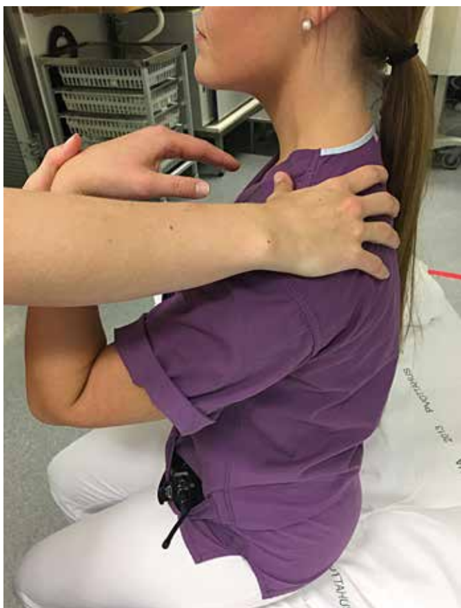
Mynd 1. Staða sjúklings við réttingu á liðhlaupi í öxl með Cunningham-aðferðinni.

ferðir til réttingar liðhlaupsins. Að reyna Cunningham-aðferðina tekur ekki langan tíma, eins og staðfestist af niðurstöðum rannsóknarinnar þar sem ekki varð marktæk breyting á meðferðartíma milli ára. Einnig fækkaði slævingum marktækt eftir innleiðslu aðferðarinnar en ekki varð marktæk breyting á notkun verkjalyfja undir húð/í vöðva/í æð.