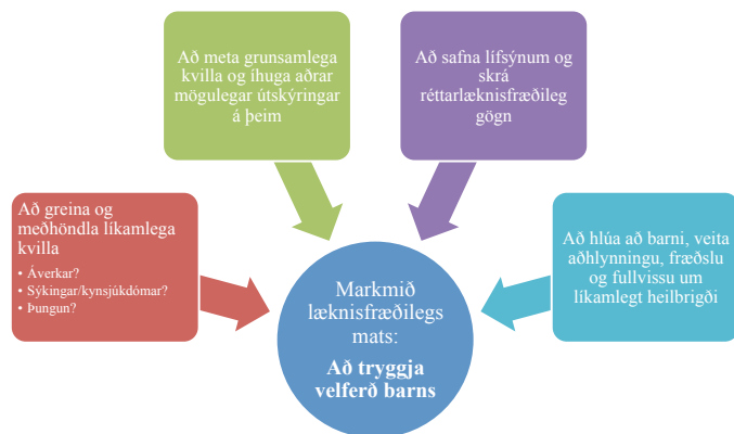
Mynd 1. Markmið læknisfræðilegs mats þegar grunur leikur á að barn hafi sætt kynferðisofbeldi. (Samantekt, MEÖ. Byggt meðal annars á óbirtri skýrslu um kynferðisofbeldi gegn börnum eftir Þóru F. Fischer og Jón R. Kristinsson).

Tilgangur rannsóknarinnar var að lýsa starfi lækna í þessari móttöku á 10 ára tímabili og meta hvort og hve oft frábrigði við skoðun hefðu bent til kynferðisofbeldis.