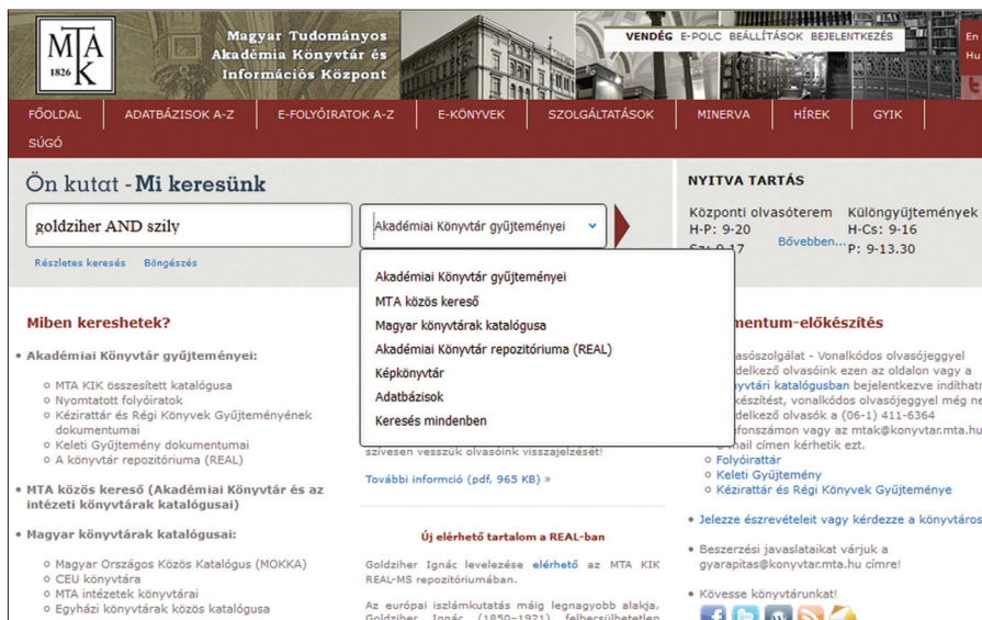
1. ábra. A nyitóoldal és a keresődoboz

illetve helyettesítő karaktereket is használhatja –, és a megfelelő scope 11 kiválasztása után indulhat a keresés.