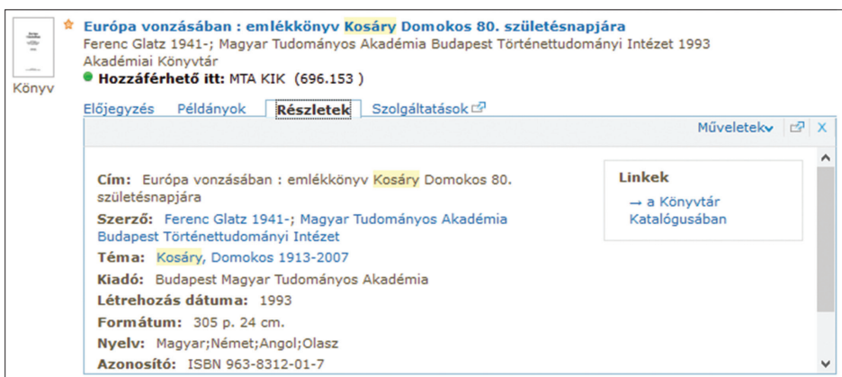
6. ábra. A tételhez kapcsolódó szolgáltatások és a Részletek ablak

A fentiek mellett további szolgáltatások érhetők el a rövid formátumú megjelenítésből. A Részletek alatt egyrészt a bővebb bibliográfiai leírást találjuk, 17 másrészt a Linkek ablakból a könyvtári katalógushoz, a tételhez kapcsolódó objektumokhoz vagy éppen a teljes szöveghez juthatunk el. A Példányok fül alatt van lehetőségünk a részletes elhelyezési adatokat megtekinteni. 18 A rendszerbe való bejelentkezés után, innen és az Előjegyzések fül alól is kezdeményezhetjük a példány előjegyzését. 19 A Szolgáltatások alatt az SFX linkfeloldásai érhetők el, amelyek révén az adott mű további elérhetőségeit fedezhetjük fel.