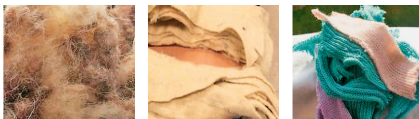
a) b) c)