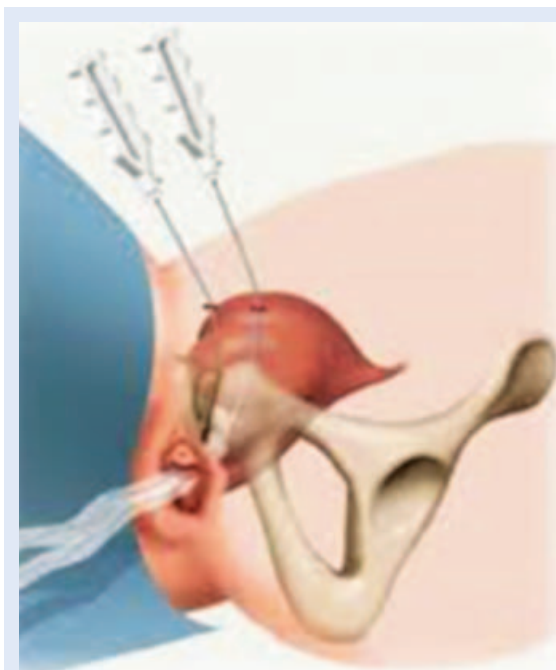
Slika 1. Shematski prikaz retropubičnog pristupa u liječenju stresne inkontinencije

Od pionirskih zahvata Ulmstena 1995. godine razvile su se do današnjih dana brojne tehnike koje imaju bazično razliku u pristupu koji može biti retropubični (TVT, SPARC – slika 1), potom transobturatorni (TVT-0, Monarc) 5,6 .