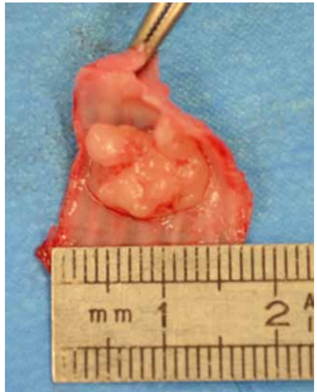
Figuur 3. Geresecceerde deel van de trachea met intraluminale massa. Het geresecceerde deel van de trachea omvatte zeven trachearingen, hetgeen overeenkomt met 16,2 tot 18,4% van de totale trachealengte bij de kat. Na het openen van het lumen was een duidelijk omschreven massa zichtbaar met afmetingen van 1,0 x 1,8 x 1,8 cm.

gecuffte, endotracheale tube (ET). Hierna kon het dier tot het einde van de ingreep mechanisch beademd worden met een TV van 100 ml, een PIP van 10 cm H 2 O en een PEEP van 1 cm H 2 O. Bij inspectie van de trachea werd een mooie appositie zonder overmatige tractie gezien. Kort voor het einde van de ingreep steeg de systolische, arteriële bloeddruk van de patiënt van 100 naar 150 mmHg hoewel deze tijdens de rest van de ingreep stabiel was gebleven rond 80 mmHg. Er werd vermoed dat deze stijging van de bloeddruk te wijten was aan een nociceptieve stimulus, waardoor besloten werd om een bolus fentanyl van 2 µg/kg IV toe te dienen, waarna de bloeddruk terug normaliseerde. De spieren en subcutis werden doorlopend gesloten met poliglecaprone 4/0 en de huid werd intradermaal gesloten met hetzelfde hechtmateriaal. De totale duur van de anesthesie bedroeg 2 uur en 50 minuten. De fentanyl CRI, de alfaxalone CRI en de mechanische beademing werden stopgezet en het hernemen van de spontane ademhaling werd visueel en aan de hand van capnografie opgevolgd. Het duurde een drietal minuten vooraleer de patiënt herstelde van apnee. Ondertussen werd de ademhaling een aantal keer manueel ondersteund via druk op de ademballon, waarna deze geleidelijk stabiliseerde op een frequentie van 17 ademhalingen per minuut. Om de postoperatieve analgesie te verzekeren werd