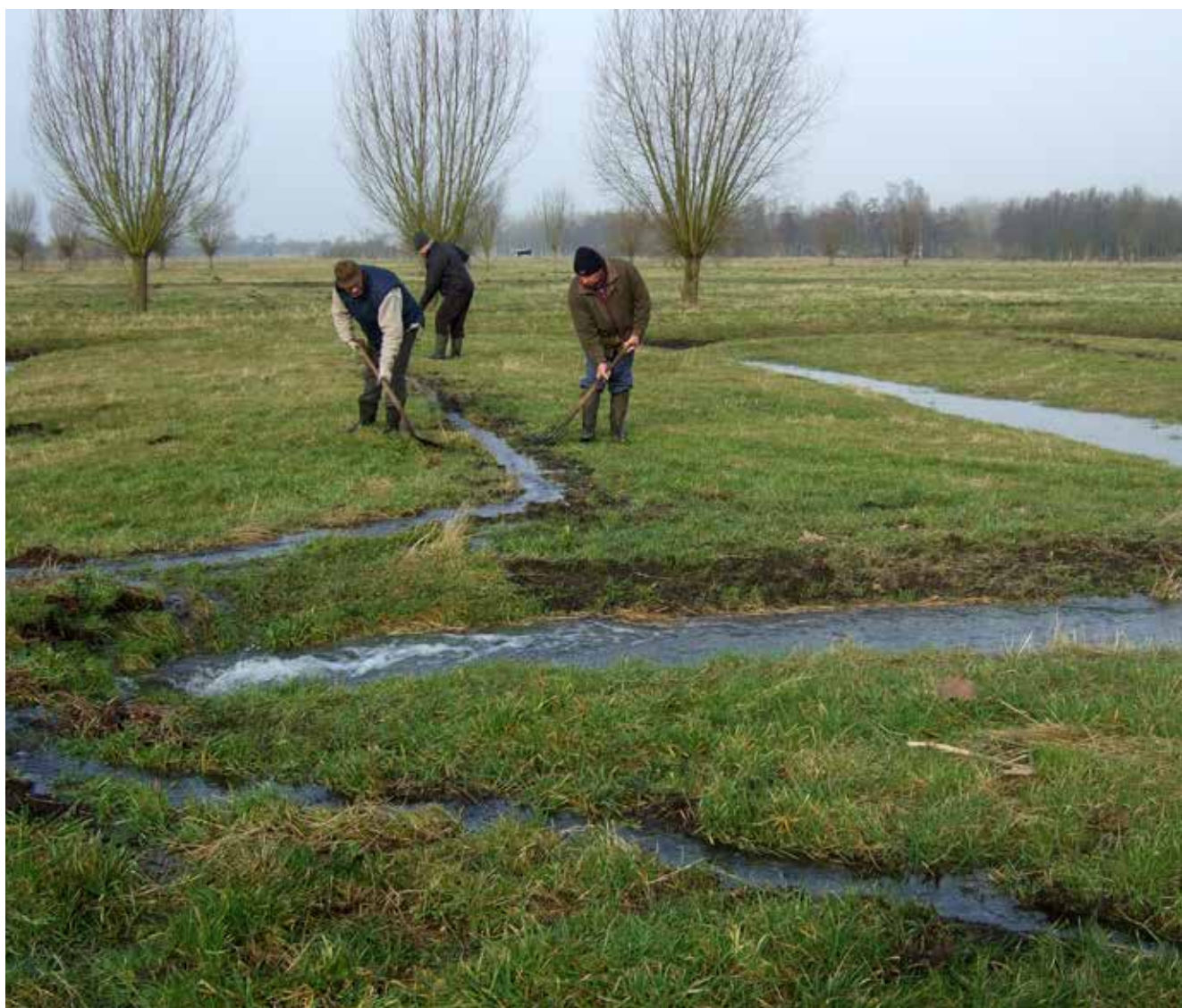
Figuur 3. Vrijwilligers van Natuurpunt Noord-Limburg aan het werk in Vloeiweiden in de Lommelse Watering.