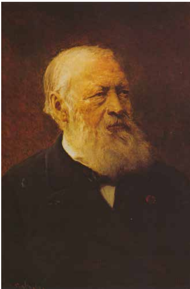
Figuur 4. Hendrik Conscience (1812-1883), volksschrijver met oog voor de natuur.