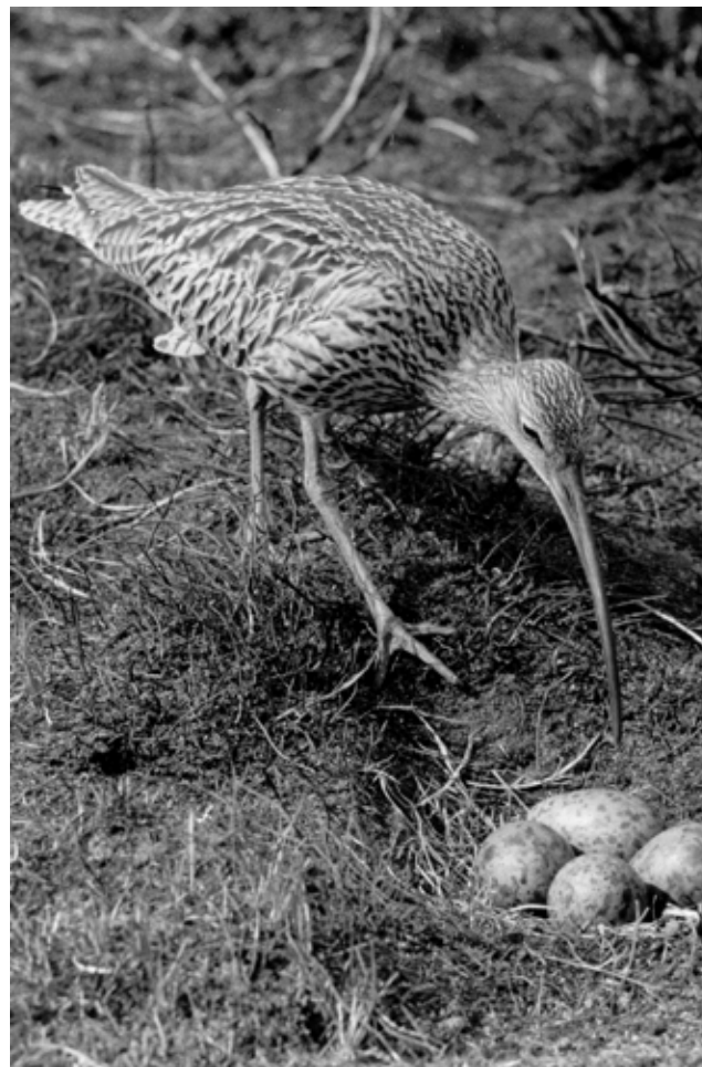
Figuur 5. Wulp alias Zandfluitier.