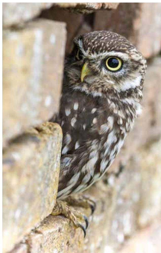
Figuur 1. Steenuil