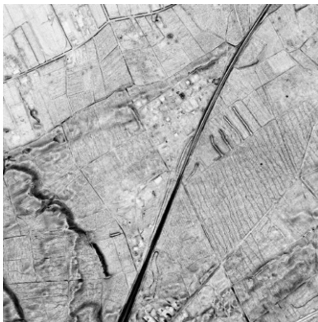
Figuur 2. Digitaal hoogtemodel van een stukje Kempische Heuvelrug. (© DHMV)