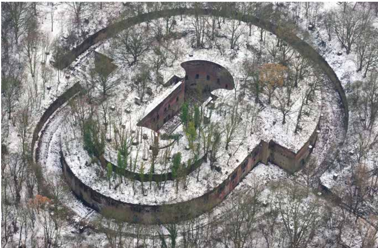
Figuur 8. Fort 7 in Wilrijk, geschiedenis en natuur beheerd door Natuurpunt Zuidrand Antwerpen.