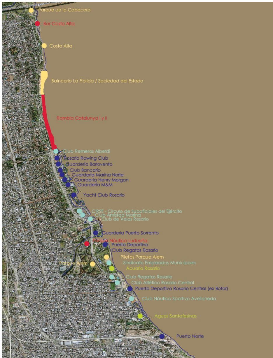
Rosario Central y Puerto Norte.