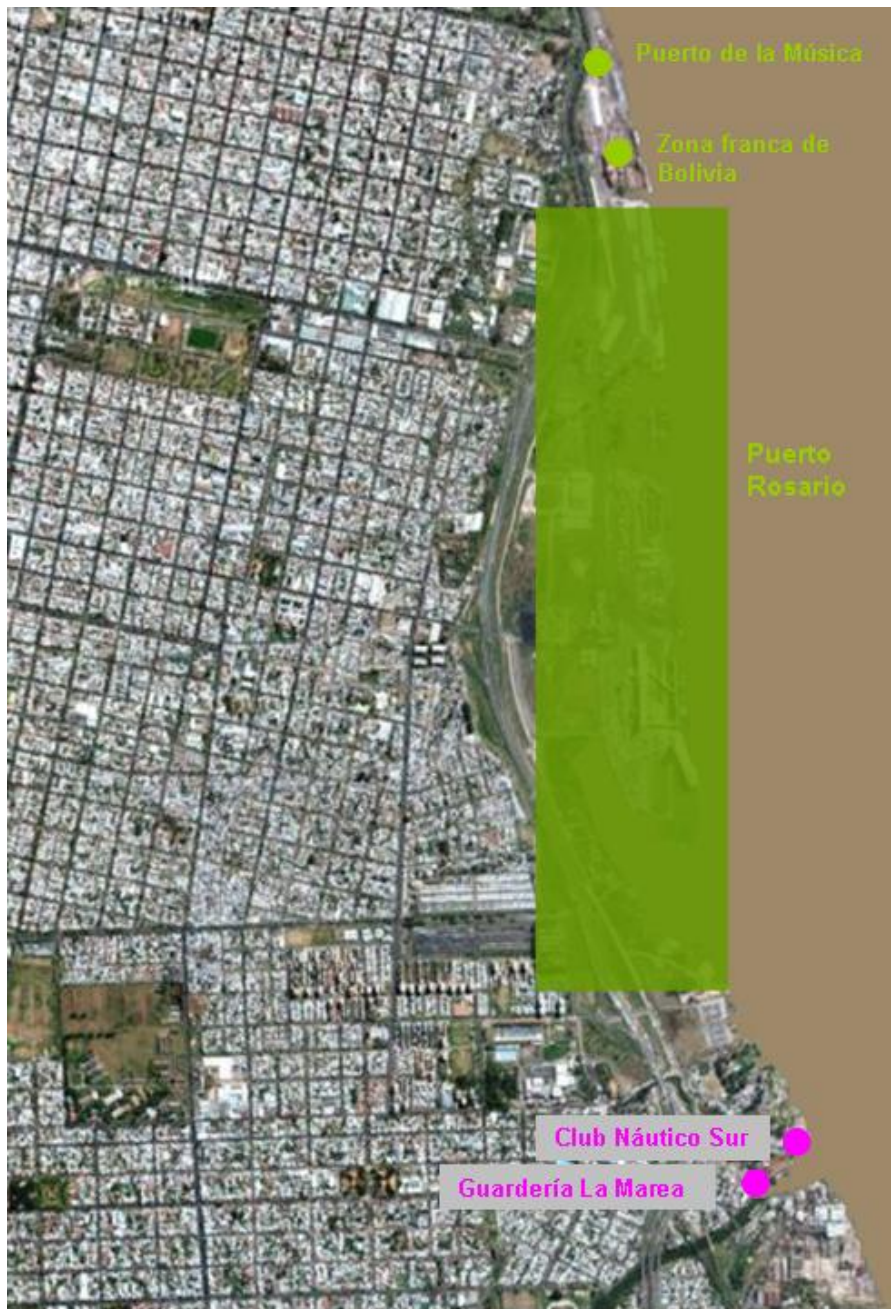
Ribera Sur.