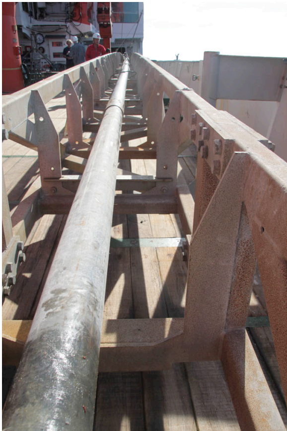
Abb. 2 15 m Schwerelot im Kernabsatzgestell

beprobte und auf die Geochemie von Porenwasser untersucht. Dabei gilt das Forschungsinteresse vor allem der Untersuchung sogenannter "Seeps". Hierbei handelt es sich um Austrittsstellen von Fluiden die durch bestimmte Prozesse aus den tieferen Sedimentschichten an die Meeresoberfläche gelangen. Während der